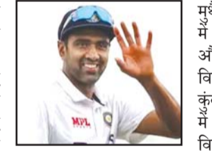
अश्विन ने इंग्लैंड के खिलाफ 23 टेस्ट की 41 पारियों में लगभग 29 की औसत से अपने 102 विकेट ले लिए हैं। वह अब इंग्लैंड और भारत के बीच हुए टेस्ट मैचों में 100 विकेट लेने वाले सिर्फ दूसरे खिलाड़ी बने हैं। इस सूची में उसे आगे सिर्फ जेम्स एंडरसन (147 विकेट) हैं।

अश्विन ने इंग्लैंड की दूसरी पारी में अपना पहला विकेट लेते ही भारत में अपने 350 टेस्ट विकेट पूरे किए। उनके फिलहाल 351 विकेट हो गए हैं। वह अनिल कुंबले के बाद ये आंकड़ा छूने वाले सिर्फ दूसरे गेंदबाज बने। कुंबले ने भारत में खेले हुए 63 टेस्ट में 24.88 की औसत के साथ 350 विकेट लिए थे। अश्विन ने 28.76 की औसत से कुल 265 विकेट लिए हुए हैं।