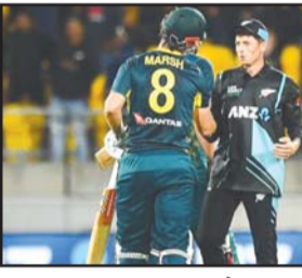
ऑस्ट्रेलिया ने न्यूजीलैंड के खिलाफ अपनी चौथी टी-20 सीरीज जीती है। अब तक दोनों टीमों के बीच 6 टी-20 सीरीज खेली जा चुकी है, जिसमें से कीवी टीम को सिर्फ 1 में जीत मिली है। इनके अलावा 1 सीरीज ड्रॉ रही है। इस सीरीज से पहले दोनों टीमों में किसी द्विपक्षीय सीरीज में

नईदिल्ली। ऑस्ट्रेलिया क्रिकेट टीम ने न्यूजीलैंड क्रिकेट टीम को तीसरे टी-20 मैच में डक वर्थ लुईस (छक्के) नियम की मदद से 27 रन से हरा दिया। इस जीत के साथ ही ऑस्ट्रेलिया ने 3-0 से सीरीज अपने नाम की। ऑस्ट्रेलिया में खेले गए मुकामले में बारिश के खलल के बीच ऑस्ट्रेलिया ने 10.4 ओवर में 118/4 का स्कोर बनाया। इसके बाद न्यूजीलैंड को 10 ओवर में 126 रन का नया लक्ष्य मिला, जिसे मेजबान टीम हासिल नहीं कर सकी।