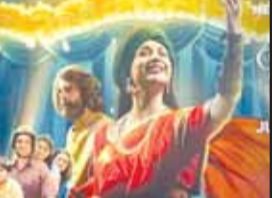
जियो सिनेमा ने अपने आधिकारिक ट्विटर द मैजिक ऑफ शिरी का पहला पोस्टर साझा किया है। इसके कैप्शन में उन्होंने लिखा, शिरी लेकर आ रही है उम्मीद की एक जादुई कहानी।

टीवी जगत की जानी-मानी अभिनेत्री दिव्यांका त्रिपाठी इन दिनों अपनी आगामी वेब सीरीज द मैजिक ऑफ शिरी को लेकर सुर्खियों में बनी हैं। जहां निर्माताओं ने कुछ दिनों पहले इसका टीजर जारी किया था, वहीं अब द मैजिक ऑफ शिरी का पहला पोस्टर सामने आ चुका है, जिसमें दिव्यांका जादूगरनी की भूमिका में नजर आ रही हैं। द मैजिक ऑफ शिरी ओटीटी प्लेटफॉर्म जियो सिनेमा पर रिलीज होगी। इसका प्रीमियर 13 जुलाई से किया जाएगा।