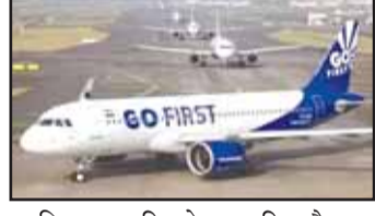
अधिस्थगन की घोषणा की और निर्लंबित निदेशक मंडल को आईआरपी के साथ सहयोग करने का निर्देश दिया। हफ्तेभर ने गो फर्स्ट को अपना काम और वित्तीय बाध्याताओं को पूरा करते रहने देने के साथ किसी भी कर्मचारी की छंटी नहीं करने को कहा है। वैश्विक विमान इंजन निर्माता प्रैट

नई दिल्ली। नेशनल कंपनी लॉ ट्रिब्यूनल (एनसीएलटी) ने वाडिया समूह की कम लागत वाली एयरलाइन गो एयरलाइंस (ईडिया) लिमिटेड द्वारा दायर स्वेच्छिक दिवाला याचिका को स्वीकार कर लिया और अंतरिम समाधान पेशोवर (आईआरपी) नियुक्त किया। वहीं एयरलाइन ने नई दिल्ली 1 मई (आरएनएस)। 2 मई, 2023 को समाधान के लिए एक याचिका के साथ एनसीएलटी से संपर्क किया था ताकि वह अपने विमानों को पट्टेदारों के कब्जे से बचा सके। नेशनल कंपनी लॉ ट्रिब्यूनल (एनसीएलटी) ने बुधवार को वाडिया समूह की कम लागत वाली एयरलाइन गो एयरलाइंस (ईडिया) लिमिटेड द्वारा अधिस्थगन की घोषणा की और निर्लंबित निदेशक मंडल को आईआरपी के साथ सहयोग करने का निर्देश दिया। हफ्तेभर ने गो फर्स्ट को अपना काम और वित्तीय बाध्याताओं को पूरा करते रहने देने के साथ किसी भी कर्मचारी की छंटी नहीं करने को कहा है। वैश्विक विमान इंजन निर्माता प्रैट