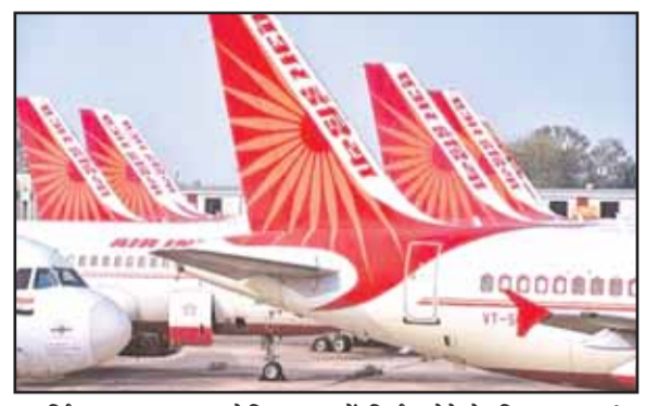
कर्मशियल पायलट एसोसिएशन (आईसीपीए) और इंडियन पायलट गिल्ड (आईपीजी) ने एयरलाइन के संशोधित मुआवजे के ढांचे पर चर्चा के लिए मंगलवार को एक संयुक्त बैठक बुलाई।