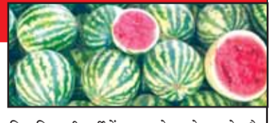
चिलचिलाती गर्मी में त्वचा को हाइड्रेट रखने और ठंडक पहुंचाने में मदद करेगा। *ये फेस पैक त्वचा में कसाव लाएगा और आपको जवां बनाने में मदद करेगा। तरबूज और नींबू का फेस पैक *तरबूज का पल्प निकाल लीजिए। *इसमें नींबू का रस मिलाकर इसका एक अच्छा सा मिश्रण बना लीजिए। *अब इसे त्वचा पर 15 से 20 मिनट लगा रहने दीजिए। *इसके बाद त्वचा को साफ पानी से धो लीजिए। *इस फेस पैक से त्वचा की डेड सेल को एक्सफोलिएट करने में मदद मिलेगी। तरबूज और दही का फेस पैक *इस फेस पैक को बनाने के लिए दो चम्मच दही में एक चम्मच तरबूज का रस मिलाएं। *इस पेस्ट को चेहरे पर 15 से 20 तक लगाएं। *अब त्वचा को सादे पानी से साफ कर लें। *गर्मी में सन डैमेज के कारण त्वचा मुझा जाती है, इस फेस पैक को लगाने से त्वचा पर निखार आएगा। *ड्राई स्किन और रेशेज की समस्या दूर होगी

गर्मी के दिनों में त्वचा का ख्याल रखना काफी जरूरी हो जाता है क्योंकि जब आपका शरीर डिहाइड्रेट होता है तब इसका सीधा असर चेहरे पर नजर आता है। स्किन डल होने के साथ काली पड़ जाती है। तरबूज का इस्तेमाल करके गर्मियों में होने वाली त्वचा से जुड़ी परेशानियों को दूर कर सकते हैं। तरबूज में फाइबर, पोटेशियम, आयर्न, विटामिन बी, विटामिन सी, विटामिन ए, जैसे पोषक तत्व पाए जाते हैं। ये फल त्वचा के लिए एंटी ऑक्सीडेंट की तरह काम करते हैं। इन गुणों की वजह से स्किन इन्फ्लेमेशन ठीक हो जाता है। त्वचा हाइड्रेट होती है। जलन-सूजन की समस्या दूर होती है। त्वचा पर निखार आता है। आप तरबूज से बने फेस पैक को त्वचा पर अपनाई करके सारी समस्याओं से छुटकारा पा सकते हैं। तरबूज और दूध का फेस पैक *तरबूज के पल्प को निकाल लीजिए। *अब इस पल्प में 2 चम्मच दूध मिलाएं। *इसका एकअच्छा सा पेस्ट तैयार कर लीजिए। *अब इसे पूरे चेहरे पर 20 मिनट तक लगाकर रखें, इसके बाद चेहरे को साफ कर लें। *दूध त्वचा के लिए प्राकृतिक क्लींजर की तरह काम करेगा। *तरबूज