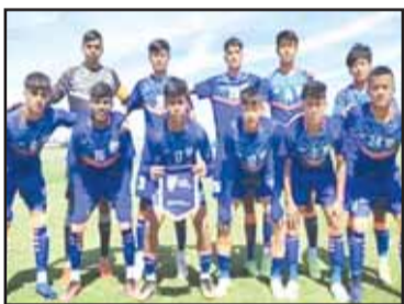
यूरोपीय देश में खेल रहे हैं। टीम ने पहले रियल मैड्रिड अंडर-17 के खिलाफ 3-3 से ड्रा खेला था और एटलेटिको को 2-1 से मात दी थी। भारतीय टीम लेगानेस युवा टीम से भी भिड़ी थी।

ओट्टो डी हेरोरोसा भारतीय अंडर-17 पुरुष फुटबॉल टीम को गेटाफे अंडर-17 टीम के खिलाफ 1-3 से हार का सामना करना पड़ा। अभ्यास मैच के 12वें मिनट में कोरु के गोल से भारत ने बढ़त बनायी, लेकिन गेटाफे ने जवाब में पहले हाफ में तीन गोल कर जीत पर मुहर लगा दी। भारतीय युवा जून में थाईलैंड में होने वाले एएफसी अंडर-17 एशियाई कप की तैयारी के तहत