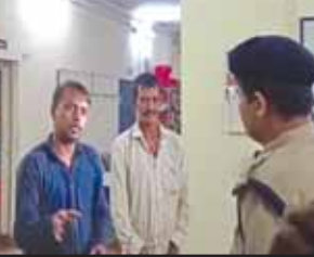
भिलाई (आरएनएस)। पिछले दिनों बच्चा चोर होने के शक में कुछ तीन साधुओं की पिटाई करने के मामलों में पुलिस ने पांच लोगों को गिरफ्तार किया है।