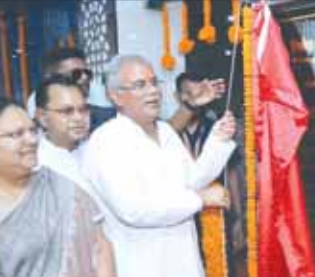
मुख्यमंत्री ने कांकेर में देश के सबसे बड़े मिलेट प्रमस्करण उद्योग का किया लोकार्पण।

मुख्यमंत्री बघेल ने इस अवसर पर कहा कि आने वाले समय में छत्तीसगढ़ देश का मिलेट हब बनेगा। आज कांकेर के नथियानवागांव में लघु धान्य प्रोसेसिंग इकाई का शुभारंभ किया गया है, जिससे कोदो-कुटकी-रागी की खेती करने वाले किसानों के साथ-साथ महिला स्व-सहायता समूहों को भी फायदा मिलेगा। उन्होंने कहा कि मिलेट मिशन के अंतर्गत स्थापित यह इकाई भारत की सबसे ज्यादा क्षमता वाली इकाई है। इस इकाई