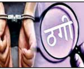
शेयर मार्केट में ऑनलाइन निवेश के नाम पर ठगी करने वाली कंपनी के पूर्व में गिरफ्तार डायरेक्टर के सहयोगी की गिरफ्तारी करने में राज्य साइबर पुलिस थाना को सफलता मिली।

रायपुर (आरएनएस)। एक डॉक्टर के साथ व्हाट्सएप के माध्यम से शेयर मार्केट में ऑनलाइन निवेश के नाम पर फ्राड करने वाले एक आरोपी को पुलिस ने गिरफ्तार किया है। मामलों में पूर्व में कंपनी के डायरेक्टर को गिरफ्तार किया जा चुका है।