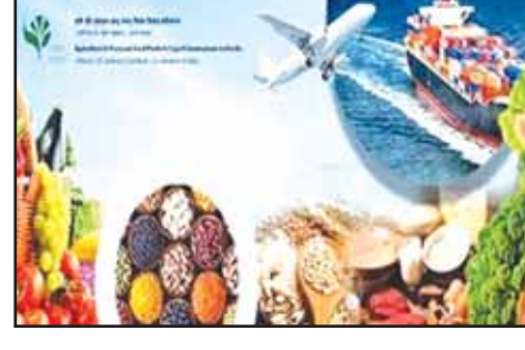
करना और इनका प्रसार करना है। यह समझौता एपीडा के सचिव और