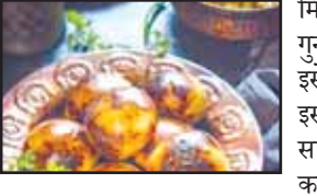
मिलाकर मसल लें और गुनुगुने पानी से आटा गूंध लें। इसे 20 मिनट ढककर रखें। इसके बाद भरावन की सारी सामग्री मिलाकर एकसाथ कर लें। अब आटे की लोई पर रखकर मध्यम आंच पर सेंकें। अच्छी तरह सिकने पर पिघले घी में डालते जाएं। सर्व करते समय चाहें तो धी छान लें। वैसे तो लिट्टी गोबर के उपलों पर सेंकते हैं लेकिन समय और सुविधा को ध्यान में रखते हुए आप इन्हें तंदूर, अवन, कुकर या माइक्रोवेव में भी सेंक सकती हैं। आलू का चोखा बनाने के लिए आलू तो आलू उबालकर फोड़े या रोस्ट कर छील लें। इसके बाद भर्ते की तरह पल्प बनाकर आलू में सारे मसाले मिला दें। बैंगन का चोखा बनाने के लिए बैंगन और टमाटर रोस्ट करने के बाद उसे छीलकर मैश करें और सारे मसाले मिला दें। चोखे में कच्चा सरसों का तेल जरूर डालें। इससे उसका स्वाद बढ़ जाएगा।

सामग्री : 4 कप आटा, 1/2 टीस्पून अजवायन, 1/2 टीस्पून बेकिंग सोडा, 3/4 टीस्पून नमक, धी भरावन की सामग्री- 2 कप सतु, 1 टीस्पून अदरक बारीक कटा, 2-3 हरी मिर्च बारीक कटी, 2 टेलबलस्पून हरा धनिया बारीक कटा, 1/2 टीस्पून जीरा, 1/2 टीस्पून सोंफ, 1/4 टीस्पून नमक, 2 टीस्पून सरसों का तेल आलू के चोखे के लिए- 2 आलू उबले हुए, 1 हरी मिर्च बारीक कटी, 1/4 टीस्पून अदरक बारीक कटा, 1 टीस्पून हरा धनिया, 1/2 टीस्पून सरसों का तेल, 1/2 टीस्पून लाल मिर्च पाउडर, स्वादानुसार नमक बैंगन के चोखे के लिए- 1 बड़ा बैंगन, 2 टमाटर, 2 हरी मिर्च, 1 टीस्पून अदरक बारीक कटा, 1 टीस्पून हरा धनिया बारीक कटा, 2 टीस्पून सरसों का तेल, स्वादानुसार नमक विधि : आटे में नमक, अजवायन, बेकिंग सोडा मिलाने के बाद उसमें चार बड़े चम्मच धी