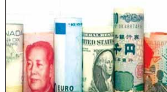
सप्ताह में यह 16 करोड़ डॉलर घटकर 635.667 अरब डॉलर था। आरबीआई के जारी साप्ताहिक आंकड़ों के अनुसार 7 जनवरी को खत्म हुए सप्ताह में विदेशी मुद्रा भंडार में यह गिरावट मुख्य रूप से

नई दिल्ली। देश के विदेशी मुद्रा भंडार में लगातार फिर कमी आई है। 7 जनवरी 2022 को खत्म हुए सप्ताह में यह 87.8 करोड़ डॉलर घटकर 632.736 अरब डॉलर पर आ गया है। भारतीय रिजर्व बैंक यानी आरबीआई के ताजा आंकड़ों के मुताबिक इससे पहले 31 दिसंबर 2021 को खत्म हुए सप्ताह में विदेशी मुद्रा भंडार 1.466 अरब डॉलर घटकर 633.614 अरब डॉलर रहा था। इसी तरह 24 दिसंबर को खत्म हुए सप्ताह में विदेशी मुद्रा भंडार 58.7 करोड़ डॉलर घटकर 635.08 अरब डॉलर रह गया था। वहीं, 17 दिसंबर, 2021 को खत्म हुए