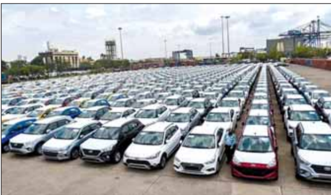
जल्द सुधर जायेगा। सोसाइटी ऑफ इंडियन ऑटोमोबाइल मैनुफैक्चरर्स (सियाम) के ताजा आंकड़ों के मुताबिक दिसंबर 2021 में

नई दिल्ली। वाहन उद्योग के निकाय सियाम ने कहा कि सेमीकंडक्टर की कमी के कारण उत्पादन प्रभावित होने के चलते कारखानों से डीलरों को यात्री गाड़ियों की आपूर्ति पिछले साल दिसंबर में 13 प्रतिशत घटकर पांच साल के न्यूनतम स्तर पर आ गई। दिसंबर 2020 में 2,52,998 इकाइयों की तुलना में पिछले महीने 2,19,421 इकाइयों की आपूर्ति हुई। उद्योग निकाय ने स्वीकार किया कि अल्पावधि में नाटकीय रूप से चिप की कमी दूर नहीं होगी, लेकिन उम्मीद जताई कि हालात