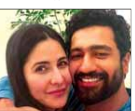
जुड़ गया है और वह है विक्की कौशल। खास बात है कि फिल्म के निर्माता विक्की को उनकी पत्नी बन चुकीं कैटरिना कैफ के अपोजिट कास्ट करने वाले हैं। यह विक्की और कैटरिना की साथ में पहली फिल्म हो सकती है। सूत्रों ने कहा है कि विक्की हर हाल में इस फिल्म का हिस्सा बनेंगे और

फिल्म जी ले जरा पिछले काफी समय से सुर्खियों में है। यह फिल्म इसलिए भी चर्चा में है, क्योंकि इसमें एक शानदार स्टारकास्ट नजर आने वाली है। फिल्म में एक या दो नहीं, बल्कि तीन हसीनाएं नजर आएंगी। प्रियंका चोपड़ा, कैटरिना कैफ और आलिया भट्ट को फिल्म के लिए कास्ट किया गया है। अब इससे अभिनेता विक्की कौशल का नाम भी जुड़ गया है। वह फिल्म में कैटरिना के अपोजिट नजर आ सकते हैं। रिपोर्ट के मुताबिक, जी ले जरा से अब एक अभिनेता का नाम भी