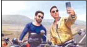
आए हैं। काले लिबाज में टुमका लगाते अक्षय क्या खूब जंच रहे हैं। इसमें दिखाया गया है कि कैसे कुछ फैस उनके साथ सेल्फी लेने की बात कहते हैं। अक्षय ने अपने ट्विटर पोस्ट में लिखा, पेश है सेल्फी। एक ऐसा सफर जो आपको भरपूर मनोरंजन, हंसी और भावनाओं की ओर ले जाएगा। जल्द शुरू होगी शूटिंग।