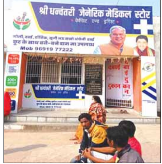
का मुख्य उद्देश्य स्वास्थ्य सुविधाओं में विस्तार के साथ-साथ सस्ती दवाइयां सभी की पहुंच में हो सके जिससे कि

रायगढ़। प्रदेश की जनता को रियायती दरों पर दवा उपलब्ध कराने के लिए नगरीय क्षेत्रों में धन्वंतरी दवा योजना का शुभारंभ 20 अक्टूबर 2021 को किया गया था। छत्तीसगढ़ सरकार ने आधी कीमत पर दवा उपलब्ध कराने के लिए राज्य के 169 शहरों में 188 दवा दुकानें खोलने का फैसला किया है।