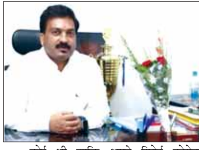
कोई भी व्यक्ति अपने रिपोर्ट कोरोना फॉजीटिव आने पर घबरायें नहीं, धैर्य से काम लें तथा क्रॉरेटाइन में रहते हुए नियमित दवाईयो का सेवन करें और कोरोना संक्रमण को फैलने से बचाएं।

रायगढ़। वर्तमान में जिले में कोरोना का ग्राफ बढ़ रहा है, कोरोना के केस के बढ़ती हुई स्थिति को देखते हुए सीएमएचओ डॉ.एस.एन.केशरी ने समस्त जिलेवासियों से आग्रह किया है कि सभी नियमित मास्क लगायें व सामाजिक दूरी का पालन करें।