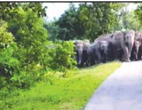
दिया। इस दौरान एक दर्जन किसानों की फसल हाथियों ने रौंद दी। इसी प्रकार कटघोरा डिविजन के ही केदई रेंज में ही गांव पहुंचा और एक समूह में 8 हाथी हैं जबकि दूसरे में 33 हाथी। 8 हाथियों का दल

कोरबा (आरएनएस)। जिले के कटघोरा वनमंडल के केदई व पसान रेंज में हाथियों का उत्पात अभी भी जारी है। शनिवार की रात इन दोनों ही परिक्षेत्र में घूम रहे हाथियों ने बनिया, पुलसर, कोरबी-लालपुर में डेढ़ दर्जन से अधिक किसानों की फसल रौंद दी। जिससे संबंधित किसानों को भारी नुकसान उठाना पड़ा है। आज सुबह वन अमले ने हाथी पीड़ित गांवों में पहुंचकर नुकसानी का सर्वे किया और इसकी रिपोर्ट तैयार कर अधिकारियों को सौंप दी है। कटघोरा डिविजन के पसान रेंज में 7 हाथियों का दल मौजूद है जो बीती रात बनिया गांव में पहुंच गए और यहां पहुंचते ही उत्पात मचाना शुरू कर