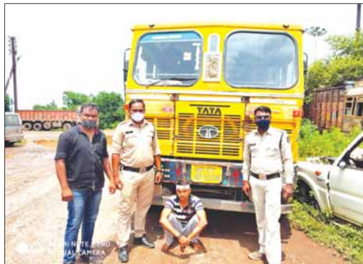
गिरधारी साव मुखबिरों को सक्रिय कर पतासाजी तेज किया गया, देर रात थाने के विवेचकों की अलग-अलग गड्ढमरिया रोड पर आरोपी के कब्जे टीमें बनाकर हाइवा और आरोपी की से हाइवा को बरामद किया गया।

रायगढ़। दिनांक 28.08.2021 की रात्रि जूटमिल चौकी क्षेत्र में हुई हाईवा लूटपाट के आरोपी तथा लूटी हुई हाईवा को घटना के चंद घंटों बाद पुलिस की कड़ी नाकेबंदी व सघन पतासाजी में सजुटमिल पुलिस को आरोपी को मय लूट की मशरूका बरामदगी में सफलता मिली है।