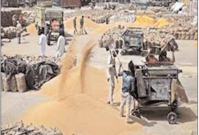
800646 किसानों से 36.99 लाख मीट्रिक टन गेहूं की खरीद की गई। 2018-19 में 52.92 लाख मीट्रिक टन गेहूं खरीदकर 11,27,195 किसानों को भुगतान किया। 2019-20 में 19 में 9231.99 करोड़, 2019-20 में 6889.15 करोड़ और 2020-21 में 6885.16 करोड़ रुपये का भुगतान किया गया।

37.04 लाख मीट्रिक टन और 2020-21 में 35.76 लाख मीट्रिक टन गेहूं खरीद की गई। वहीं सपा सरकार में वर्ष 2015-16 में 403141 किसानों से 22.67 लाख मीट्रिक टन गेहूं खरीदा गया। 2016-17 में केवल 7.97 लाख मीट्रिक टन गेहूं खरीद की गई। 2013-14 में सबसे कम केवल 6.83 लाख मीट्रिक टन गेहूं की खरीद की गई। राज्य सरकार ने 2017-18 में 6011.15 करोड़, 2018-19 में 6885.16 करोड़ रुपये का भुगतान किया गया। 2017-18 में 6011.15 करोड़, 2018-19 में 6885.16 करोड़ रुपये का भुगतान किया गया। 2019-20 में 9231.99 करोड़, 2019-20 में 6889.15 करोड़ और 2020-21 में 6885.16 करोड़ रुपये का भुगतान किया गया। जबकि अखिलेश सरकार में वर्ष 2012-13 में 6504.45 करोड़, 2013-14 में 921.96 करोड़, 2014-15 में 879.23 करोड़, 2015-16 में 3287.26 करोड़ और 2016-17 में 1215.77 करोड़ रुपये का भुगतान किसानों को किया गया।