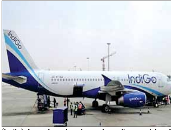
इंडिगो ने कहा कि उसने मार्च और अप्रैल में किसी कर्मचारी का वेतन नहीं काटा। मई से उसने वेतन में कटौती और बिना वेतन

नई दिल्ली (आरएनएस)। देश की सबसे बड़ी विमान सेवा कंपनी इंडिगो ने खस्ता वित्तीय स्थिति का हवाला देते हुए करीब ढाई हजार कर्मचारियों की छंटनी की घोषणा की है। कंपनी ने सोमवार को बताया कि खराब वित्तीय स्थिति के कारण वह 10 प्रतिशत कर्मचारियों को नौकरी से निकालेगी। एयरलाइंस में करीब 24 हजार कर्मचारी हैं। इस प्रकार तकरीबन ढाई हजार लोगों की रोजी-रोटी छिन जाएगी। इनमें पायलट और कैंबिन कर्ष समेत सभी श्रेणी के कर्मचारी शामिल