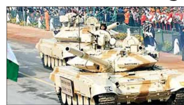
हटाने वाले 1,512 उपकरणों की खरीद के लिए आज भारत अर्थ

नई दिल्ली, 20 जुलाई (आरएनएस)। सरकार के मेक इन इंडिया पहल को बढ़ावा देने के उद्देश्य से रक्षा मंत्रालय की खरीद इकाई ने 557 करोड़ रुपये की अनुमानित लागत से टी टैंक-90 एस/एसके के लिए बारूदी सुरंग