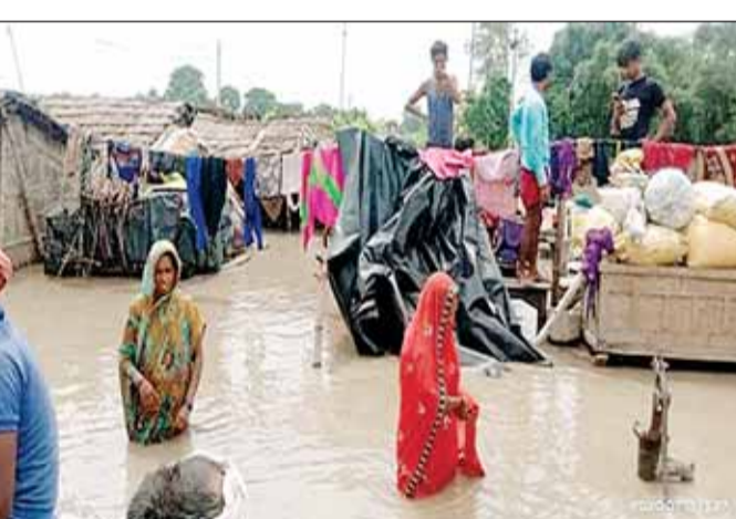
रोसर रेल पुल के पास खतरे के निशान से ऊपर बह रही है। कोसी का जलस्तर स्थिर बना हुआ है लेकिन गंडक नदी के जलस्तर में बढ़तेरी दर्ज की गई है। कोसी का जलस्तर वीरपुर बैराज के

पटना (आरएनएस)। बिहार और नेपाल के तराई क्षेत्रों में हो रही बारिश के बाद राज्य की सभी प्रमुख नदियों के जलस्तर में वृद्धि हुई है। राज्य के कई नए क्षेत्रों में बाढ़ का पानी प्रवेश कर गया है। राज्य की कई नदियां खतरे के निशान से ऊपर बह रही हैं जिससे आठ जिलों की करीब तीन लाख की आबादी प्रभावित हुई है। बाढ़ प्रभावित इलाकों में राहत एवं बचाव कार्य चलाए जा रहे हैं। इधर, विपक्ष का आरोप है कि बाढ़ के नाम पर राहत रामधरोसे और प्रभावित लोग भगवान धरोसे हो गए हैं। बिहार जल संसाधन विभाग के अनुसार, सोमवार को बागमती नदी सीतामढ़ी के डेहा, सोनाखान, डूबाधार तथा कटौड़ा और मुजफ्फरपुर के बेनीबाद और दरभंगा के हायाघाट में खतरे के निशान के ऊपर बह रही है, जबकि बूढ़ी गंडक समस्तीपुर के