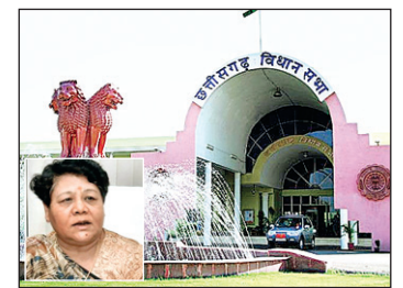
रायपुर। छत्तीसगढ़ विधानसभा में आज राज्यपाल सुश्री अनुसुइया उइके के अभिभाषण पर कृतज्ञता ज्ञापन पारित किया गया। मुख्यमंत्री श्री भूपेश बघेल ने चर्चा का जवाब देते हुए एक बार दोहराया कि किसानों को धान की प्रति क्विंटल 2500 रूपए कीमत दी जाएगी। श्री बघेल ने कहा कि जिन किसानों को टोकन दिए गए हैं उनका धान खरीदा जाएगा। हर जिले में सचिव स्तर के अधिकारी जाकर परीक्षण करेंगे और उसके बाद धान खरीदी की जाएगी। बघेल

घर में बिना बताए कहीं चली गई। बालिका को अंतिम बार दोपहर में पड़ोसी ने जंदल अस्पताल के आगे अकेली देखा था। बालिका अब तक घर नहीं आई है ना ही उसका कहीं पता चला है। गुप्त रिपोर्ट पर थाना कोतारोड़ में अज्ञात आरोपी के विरुद्ध अपराध क्रमांक 28/धारा 363 भादवि के तहत अपराध पंजीबद्ध कर विवेचना में लिया गया है।