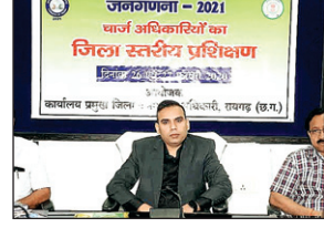
जनगणना 2021 चार्ज अधिकारियों का दो दिवसीय प्रशिक्षण संपन्न हुआ।