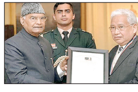
उन्होंने इस अवसर पर अपने संबोधन में कहा कि 'हमने पिछले सालों में कुष्ठ रोग के खिलाफ चलाए गए अभियान में काफी कुछ हासिल किया है। प्रति सप्ताह हजार आबादी पर एक मामले से भी कम के रूप में परिभाषित कुष्ठ उन्मूलन के स्तर को हासिल किया गया है। इसके अलावा, कुष्ठ रोग के खिलाफ पूर्वाग्रह तथा उसे एक सामाजिक अभिशाप के रूप में देखने का चलन, वैज्ञानिकों, शोधकर्ताओं, संगठनों और सामुदायिक कार्यकर्ताओं के निरंतर काम की बदौलत काफी कम हो गया है। हालांकि इसके बावजूद हम इस रोग के खिलाफ अपनी सतर्कता कम नहीं कर सकते क्योंकि इसके नए मामले प्रकाश में आते रहते हैं।' उन्होंने कहा कि कुष्ठ नियंत्रण गतिविधियों में प्रमुख चुनौती नियंत्रण गतिविधियों पर ध्यान केंद्रित रखना तथा इसमें सतता बनाए रखना है।