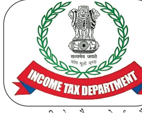
चेन्नई (आरएनएस)। आयकर विभाग ने तमिलनाडु के एक निर्माता, एक जाने-माने अभिनेता, उनके वितरक और कोषाध्यक्ष सहित फिल्म उद्योग की 4 प्रमुख हस्तियों के परिसरों की 05-02-2020 को तलाशी ली।

चेन्नई (आरएनएस)। आयकर विभाग ने तमिलनाडु के एक निर्माता, एक जाने-माने अभिनेता, उनके वितरक और कोषाध्यक्ष सहित फिल्म उद्योग की 4 प्रमुख हस्तियों के परिसरों की 05-02-2020 को तलाशी ली। इन सभी हस्तियों के बीच समानता हाल की फिल्म की सफलता थी जो बॉक्स ऑफिस पर लगभग 300 करोड़ रुपये की कमाई कर चुकी थी। समूह के लगभग 38 परिसरों की तलाशी ली गई और चेन्नई और मदुरै में सर्वेक्षण कार्य किया गया। चेक जिन्हें कोलेटरल सुरक्षा के रूप में लिया गया था, उन्हें जब्त कर लिया गया। तलाशी के दौरान पाए गए सबूतों के अनुसार, अनुमान है कि इस मामले में 300 करोड़ रुपये से अधिक धनराशि को छिपाने का प्रयास किया गया। वितरक, जो तलाशी लिए गए समूह का एक हिस्सा है, वह एक बिल्टर्ड भी है। ठिकाने से बरामद वितरक से संबंधित सभी दस्तावेज मौलिक हैं। बरामद दस्तावेजों वाला परिसर उसके दोस्त का घर था। सबूतों की जांच की जा रही है।