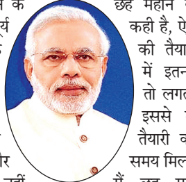
अपने भाषण के बीच पीएम ने राहुल का नाम लिए और उनकी डंडा मारने संबंधी टिप्पणी की चर्चा की। मोदी ने कहा कि लोग मुझे डंडे मारने की बात कहते हैं। इतना भी आसान नहीं है इसलिए उन्होंने

संबंधी राहुल के बयान के जवाब में पीएम ने सूर्य नमस्कार के जरिए पीठ को मजबूत करने की बात कही। इस दौरान भाषण के दौरान टोकने वाले अधीर रंजन चौधरी, सौगत राय और शशि थरूर को भी नहीं बखशा। अपने भाषण के बीच पीएम ने राहुल का नाम लिए और उनकी डंडा मारने संबंधी टिप्पणी की चर्चा की। मोदी ने कहा कि लोग मुझे डंडे मारने की बात कहते हैं। इतना भी आसान नहीं है इसलिए उन्होंने छह महीने की बात कही है, ऐसा करने की तैयारी करने में इतना समय तो लगता ही है। इससे मुझे भी तैयारी करने का समय मिल गया है। मैं छह महीने में कोशिश करूंगा कि सूर्य नमस्कार की संख्या बढ़ा दूं। इसके जरिए मैं अपनी पीठ को मजबूत बना लूंगा। अपनी मेरी पीठ को ऐसा बना लूंगा कि हर तरह का डंडा झेल सकें। मेरे पास भी छह महीने का समय है। बीते 20 वर्षों में गंदी गंदी गालियां सुनते रहने के बाद अपने आपको गालीफूफ बना लिया हूँ। अब पीठ मजबूत करने की बारी आई है। इसी बीच पीएम ने जब संबोधन बचाने संबंधी विपक्ष के अभियान की चर्चा की तो राहुल अपनी सीट से खड़े हो गए। उन्होंने कुछ टिप्पणी की। ऐसा लगा कि जैसे पीएम को राहुल की टिप्पणी का ही इंतजार हो। उन्होंने मुस्कुराते हुए राहुल की ओर इशारा किया और तंज कसते हुए कहा पिछले 40 मिनट से बोल रहा हूँ, लेकिन वहां करंट अभी पहुंचा है।