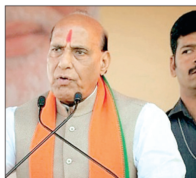
उन्होंने कहा कि, समुद्री पड़ोसियों के रूप में दोनों देशों की यह जिम्मेदारी बनती है कि वे सुरक्षित समुद्री वातावरण विकसित करें ताकि दोनों देशों के बीच व्यापार और वाणिज्य तेजी से आगे बढ़े।