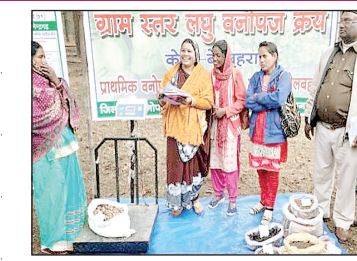
न्यूनतम समर्थन मूल्य पर खरीदी से लगभग 4 लाख संग्राहक लाभान्वित होंगे। वनोपज के व्यापार से महिला स्व-सहायता समूहों को भी जोड़ा जाएगा। महिला स्व-सहायता समूह की महिलाएं हाट बाजारों में लघु वनोपजों का क्रय करेंगी और वन-धन विकास केन्द्रों पर लघु वनोपजों के प्राथमिक प्रसंस्करण के काम में भी जुटेंगी। इसके माध्यम से लगभग 5500 महिला

22 लघु वनोपजों का न्यूनतम समर्थन मूल्य पर किया जाएगा संग्रहण महिला स्व-सहायता समूह हाट बाजारों में करेंगी लघु वनोपजों का क्रय वन धन विकास केन्द्र में होगा लघु वनोपजों का प्राथमिक प्रसंस्करण प्रसंस्करण की कमान सेंगलौली समूहों की 50 हजार महिलाएं रायपुर (आरएनएस)। मुख्यमंत्री भूपेश बघेल की मंशा के अनुरूप प्रदेश में लघु वनोपजों के संग्रहण, प्रसंस्करण और विपणन के माध्यम से ग्रामीणों को आजीविका से जोड़ने के लिए विस्तृत कार्ययोजना तैयार की गई है। राज्य सरकार द्वारा 22 लघु वनोपजों को न्यूनतम समर्थन मूल्य पर खरीदने का निर्णय लिया गया है। परियोजना के माध्यम से वनोपजों के