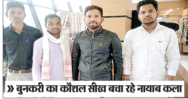
» बुनकरी का कौशल सीख बचा रहे नायाब कला

नई दिल्ली (आरएनएस)। फैशन और आधुनिकता की दौड़ में जहां आज बुनकरी की कला खतरों में है, वहीं छत्तीसगढ़ के युवा अपने हुनर को तराश कर इसे सहेजने में लगे हैं। ये युवा बुनकरी का कौशल सीख कर अपने उज्जवल भविष्य के सपनों का ताना बाना बुन रहे हैं।