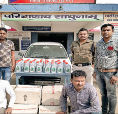
कार्य किया जा रहा था। इसी दरम्यान टी.आई. वासनिक को उनके सक्रिय मुखबिर से सूचना मिली कि ओडिसा की ओर से एक सफेद कलर की अल्टो कार जिसमें भारी मात्रा में नकली मोबिल ऑइल छत्तीसगढ़ प्रान्त में बेचने लाया जा रहा है। इस सूचना पर कंचनपुर बेरियर के पास सरिया स्टाफ द्वारा घेराबंदी किया गया था तभी सुबह-सुबह एक सफेद कलर की अल्टो कार - क्रमांक पी-80-सीई -7925 में आये दो व्यक्तियों को रोककर चेक किया गया। कार में 10 पेट्री कैस्ट्रोलजोटीएक्स 100 नग,

न्याय साक्षी/रायगढ़। तस्करों के लिये उपयुक्त माने जाने वाला सरिया - ओडिसा मार्ग में सरिया पुलिस द्वारा अंतराज्यीय गिरोह के दो तस्करों को ऑल्टो कार में डुप्लीकेट मोबिल ऑइल लेकर आते हुये आज दिनांक 01.02.2020 के तड़के कंचनपुर बेरियर के पास घेराबंदी कर पकड़ा गया। पंचायत चुनाव 2020 के द्वितीय चरण में विकासखंड सारांगढ़ एवं बरमकेला में जिला पुलिस का आधा बल शांति पूर्ण चुनाव कराने में संलग्न था। जिसे देखते हुये शांति तस्करों ने 31-01/02/2020 के रात्रि सरिया ओडिसा मार्ग से नकली मोबिल ऑयल रायागढ़ लाने की योजना बनाये थे। देर रात्रि तक टी.आई. सरिया एवं उनका स्टाफ पोलिंग पार्टीयों को बरमकेला पहुंचाने का