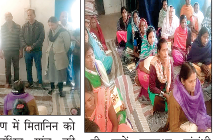
प्रशिक्षण में मितानिन को अपने संबंधित गांव की गर्भवती महिलाओं और बच्चों का स्वास्थ्य केन्द्रों के माध्यम से शत-प्रतिशत टीकाकरण करने के लिए प्रोत्साहित करने के लिए कहा गया। साथ ही उन्हें स्वास्थ्य संबंधी महत्वपूर्ण जानकारी भी दी गई। प्रशिक्षण में मितानिन को दी जाने वाली मेडिकल कीट में उपलब्ध जरूरी दवाई के बारे में बताया गया।

न्याय साक्षी/रायगढ़। रायगढ़ विकास खण्ड के ग्राम-बनोरा में आज सामुदायिक स्वास्थ्य केन्द्र लोईंग द्वारा मितानिन के लिए 1 से 3 फरवरी तक तीन दिवसीय प्रशिक्षण आयोजित किया गया।