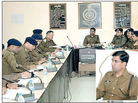
की समीक्षा के साथ मीटिंग की शुरुवात किये। पुलिस अधीक्षक महोदय द्वारा समस्त अधिकारियों को गत वर्ष की