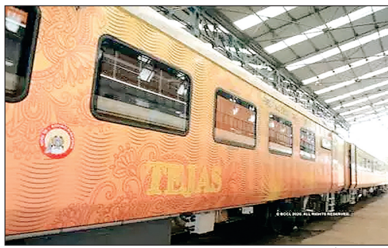
अहमदाबाद से मुंबई के बीच तेजस एक्सप्रेस देश की दूसरी प्राइवेट ट्रेन के टौर पर आधिकारिक रूप से चलाई गई। आमतौर पर सामान्य ट्रेनों से ज्यादा किराया होने और प्राइवेट ट्रेन होने के कारण इसे अन्य ट्रेनों के मुकाबले प्राथमिकता दी जा रही है। इसके बदले ट्रेन में विश्वस्तरीय सुविधाएं मिलती हैं

मुंबई (आरएनएस)। पश्चिम रेलवे पर तकनीकी कारणों से बुधवार को दहिसर और भाईदर के बीच ओवरहेड वायर में गड़बड़ी होने लगी। दोपहर 12:15 बजे के करीब हुई इस घटना के कारण अप फास्ट लाइन पर ट्रेनें बाधित हो गईं। इस गड़बड़ी के कारण 8 लोकल ट्रेनों की सर्विस रद्द करनी पड़ी, तो 4 लंबी दूरी की ट्रेनें भी लेट हो गईं। इनमें से एक हाल ही में तेजस एक्सप्रेस भी थी। अहमदाबाद से मुंबई की ओर आ रही तेजस एक्सप्रेस करीब 85 मिनट लेट हो गई थी। 19 जनवरी से