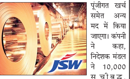
पूंजीगत खर्च समेत अन्य मद में किया जाएगा। कंपनी ने कहा, निदेशक मंडल ने 10,000 सूची बद्ध, सुरक्षित, विमोचनीय, गैर परिवर्तनीय डिबेंचर आवंटित करने की अनुमति दी है। एक डिबेंचर का मूल्य 10,00,000 रुपये है। इनका कुल मूल्य 1,000 करोड़ रुपये बनेगा।

नयी दिल्ली (आरएनएस)। जेएसडब्ल्यू स्टील की गैर-परिवर्तनीय डिबेंचर (एनसीडी) जारी करके 1,000 करोड़ रुपये जुटाने की योजना है। सज्जन जंदल की अगुवाई वाली जेएसडब्ल्यू स्टील ने गुरुवार को बंबई शेयर बाजार को बताया कि इस राशि का उपयोग कार्यशील पूंजी की जरूरतों को पूरा करने, सामान्य कंपनी कामकाज और