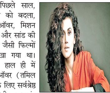
पिछले साल, तापसी को बदला, गेम ऑवर, मिशन मंगल और सांड की आंख जैसी फिल्मों में देखा गया था। उन्होंने हाल ही में गेम ऑवर (तमिल में) के लिए सर्वश्रेष्ठ अभिनेत्री का आनंद विक्टन अवॉर्ड अपने नाम किया और बॉलीवुड में सांड की आंख के लिए स्टार स्क्रीन अवार्ड्स में

अभिनेत्री तापसी पन्नू, जिन्हें हाल ही में फिल्म गेम ऑवर और सांड की आंख के लिए अवॉर्ड मिला है, उनका कहना है कि वे खुश हैं। उन्होंने अपनी परियोजनाओं के माध्यम से दर्शकों के दिमाग पर अपना प्रभाव छोड़ा।