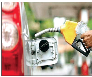
मुंबई और चेन्नई में पेट्रोल की कीमतें घट गईं। बीते 12 दिनों में देश की राजधानी दिल्ली में पेट्रोल 1.36 रुपये प्रति लीटर सस्ता हुआ जबकि डीजल के दाम में

नयी दिल्ली (आरएनएस)। पेट्रोल और डीजल के दाम में एक दिन के विराम के बाद गुरुवार को फिर गिरावट दर्ज की गई। पेट्रोल की कीमत दिल्ली और मुंबई में 17 पैसे जबकि कोलकाता में 16 पैसे और चेन्नई में 18 पैसे प्रति लीटर कम हो गई है। वहीं, डीजल का दाम दिल्ली और कोलकाता में 19 पैसे जबकि