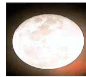
साल 2020 के आगामी ग्रहण-

नई दिल्ली (आरएनएस)। साल 2020 का पहला ग्रहण चंद्र ग्रहण इसी सप्ताह 10 जनवरी (दिन- शुकवार) को पड़ेगा। यह चंद्र ग्रहण 10 जनवरी को रात 10.37 बजे शुरू होगा और 02.42 तक चलेगा। यानी यह पहला ग्रहण चार घंटे 5 मिनट तक चलेगा। लेकिन ज्योतिषियों का मानना है कि इस बार सूतक नहीं लगेगा। यानी मंदिरों के कपाट खुले रहेंगे। इसके बावजूद भी ग्रहण या उसके अगले दिन गंगा स्नान करना व पुण्य-दान मान्य होगा। नहीं लगेगा सूतक काल : धार्मिक मान्यताओं के अनुसार इस तरह के ग्रहण को मांघचंद्र ग्रहण कहते हैं। चूँकि इस ग्रहण में चंद्रमा का कोई हिस्सा नहीं छिपेगा, बल्कि चांद मटमैला सा दिखेगा। इसलिए ज्योतिष इस तरह के ग्रहण को ग्रहण नहीं कहते। इसकी धार्मिक मान्यता नहीं है। इसलिए इस दौरान मंदिरों के कपाट बंद