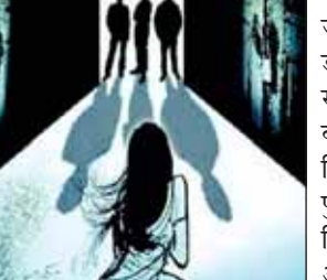
दोस्तों ने उससे गैंगरेप किया था। इस घटना के बाद पीड़िता अपने घर औरंगाबाद लौट आई थीं। पीड़िता ने डर के चलते किसी को इसकी जानकारी नहीं दी। लेकिन तबियत बिगड़ने पर उसे 25 जुलाई को अस्पताल में भर्ती करवाया गया था।

अस्पताल में जांच के दौरान डॉक्टरों को उसके साथ गैंगरेप होने की बात का पता चला। जिसके बाद उन्होंने पुलिस को सूचित किया। अस्पताल के अनुसार पीड़िता ने 24 जुलाई को अपने प्राइवेट पार्ट में तेज दर्द की शिकायत की थी। डॉक्टरों ने जांच की तो पता चला कि उसके साथ रेप हुआ है। इसके बाद पीड़िता को सरकारी अस्पताल में ट्रांसफर कर दिया गया था। पुलिस ने मामला दर्ज कर आरोपियों की तलाश शुरू की लेकिन अभी तक वो पकड़े नहीं जा सके हैं। पीड़ित लड़की ने वारदात के करीब 20 दिन तक इसकी जानकारी किसी को नहीं दी। डर के चलते उसने अपने माता-पिता को भी इस बारे में कुछ नहीं बताया। हालांकि बाद में उसकी हालत खराब हो गई जिसके चलते परिजनों को उसे लेकर अस्पताल जाना पड़ा। जहां गैंगरेप की घटना का खुलासा हुआ। लड़की के परिजनों के अनुसार मुंबई से लौटने के बाद से वो काफी परेशान थी और अपने कमरे में ही बंद रहती थीं।