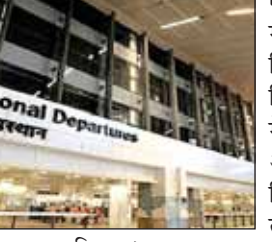
एक बड़े माफिया का हिस्सा हैं जो विदेश से भारत में सोने की और भारत से विदेशी मुद्रा की तस्करी करता जा रहे थे। उन्होंने बताया कि इनके सामान की जांच में 4,49,600 डॉलर (करीब 3,25,51,040 रुपये) मिले जो वे तस्करी कर हांगकांग ले जा रहे थे। 25 अगस्त को हांगकांग से भारत आए इन विदेशियों ने पूछताछ में स्वीकार किया कि वे

नईदिल्ली (आरएनएस)। राजस्व आसूचना निदेशालय (डीआरआई) ने कथित रूप से तस्करी कर करीब पांच लाख डॉलर हांगकांग ले जाने की कोशिश कर रहे पांच विदेशी नागरिकों को दिल्ली हवाई अड्डे से गिरफ्तार किया। अधिकारियों ने शनिवार को यह जानकारी दी। अधिकारियों ने बताया कि केंद्रीय अप्रत्यक्ष कर एवं सीमा शुल्क बोर्ड (सीबीआईसी) की प्रवर्तन ईकाई डीआरआई ने बुधवार को इंदिरा गांधी अंतरराष्ट्रीय हवाई अड्डे पर पांच विदेशियों को रोका। ये सभी ताइवान के हैं और हांगकांग