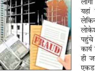
एस्टेट कंसल्टेंट के रूप में काम करता था। उसने लोगों को बख्तावरपुर में पलैट दिलाने का भरसा दिया था। उसने कहा कि उसके पास 30 एकड़ जमीन है जिसमें वेदांता वेलफेयर सोसायटी नाम से पलैट्स का निर्माण किया जा रहा है। इस दौरान उसके झांसे में आए सैकड़ों