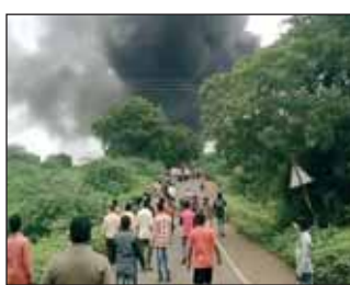
100 मजदूर काम कर रहे थे। पुलिस और प्रशासनिक अधिकारी घटनास्थल पर पहुंच गए हैं। घायलों को नजदीकी अस्पताल में भर्ती कर दिया गया है जहां हड़कप मच गया है। मौके पर फैक्ट्री के अधिकारी और कर्मचारियों के अलावा स्थानीय लोग और फायर ब्रिगेड के कर्मचारी राहत कार्य में जुटे हैं। इस दौरान करीब

धुले (आरएनएस)। महाराष्ट्र के धुले में एक केमिकल फैक्ट्री में विस्फोट हो गया। इसमें 10 लोगों की मौत हो गई और 15 लोगों के घायल होने की खबर है। धुले जिले के शिरपुर के वहाडी में एक केमिकल फैक्ट्री के बायलर में विस्फोट हो गया। विस्फोट इतना भीषण था कि इसकी गूंज दो किलोमीटर दूर तक सुनाई दी। मीडिया रिपोर्ट के मुताबिक इस कारखाने में विस्फोट के समय करीब