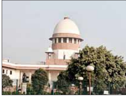
केंद्र सरकार ने कुल न्यायाधीशों की संख्या बढ़ कर 34 करने को हाल ही में मंजूरी दी थी। मुख्य न्यायाधीश रंजन गोगोई

नईदिल्ली (आरएनएस)। सुप्रीम कोर्ट के कॉलेजियम ने शीर्ष अदालत में बतौर न्यायाधीश पदोन्नत किए जाने के लिए हाईकोर्ट के चार मुख्य न्यायाधीशों के नामों की अनुशंसा की है। इन नियुक्तियों के साथ ही सुप्रीम कोर्ट में कुल न्यायाधीशों की स्वीकृत संख्या 34 हो जाएगी।