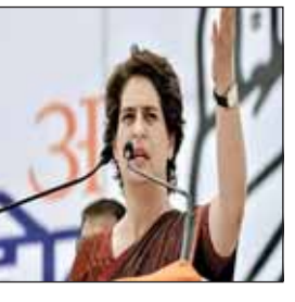
रोजगार गायब हैं। उन्होंने पूछा, अब तो साफ करो कि अर्थव्यवस्था को नष्ट करने की ये कि स क की करतूत है? गौरतलब है कि देश की आर्थिक वृद्धि दर 2019-20 की अप्रैल-जून तिमाही में घटकर पांच फीसदी रह गई है। यह पिछले सात साल का न्यूनतम स्तर है। विनिर्माण क्षेत्र में गिरावट और कृषि उत्पादन की सुस्ती से जीडीपी वृद्धि में यह गिरावट आई है। शुक्रवार को जारी आधिकारिक आंकड़ों में यह जानकारी दी गई है।

नईदिल्ली (आरएनएस)। कांग्रेस महासचिव प्रियंका गांधी वाड़ा ने आर्थिक विकास दर के पिछले सात साल के अपने न्यूनतम स्तर पर चले जाने को लेकर शनिवार को नरेंद्र मोदी सरकार पर निशाना साधा और आरोप लगाया कि भोंपू बजाने वाली भाजपा सरकार ने अर्थव्यवस्था को हालत पंचर कर दी। उन्होंने सवाल पूछते हुए कहा कि अर्थव्यवस्था को नष्ट करने का जिम्मेदार कौन है? प्रियंका ने ट्वीट किया, जीडीपी की विकास दर से साफ है कि अच्छे दिन का भोंपू बजाने वाली भाजपा सरकार ने अर्थव्यवस्था की हालत पंचर कर दी है। न जीडीपी प्रोथ है, न रुपए की मजबूती।