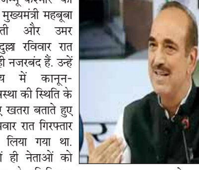
आज़ाद ने कहा, पैसे देकर आप किसी को भी अपने साथ ले सकते हैं। आज़ाद ने कहा कि कश्मीर के लोगों पर कर्फ्यू लगाकर और स्थानीय नेताओं को नजरबंद कर कानून बनाया गया है। भारत के