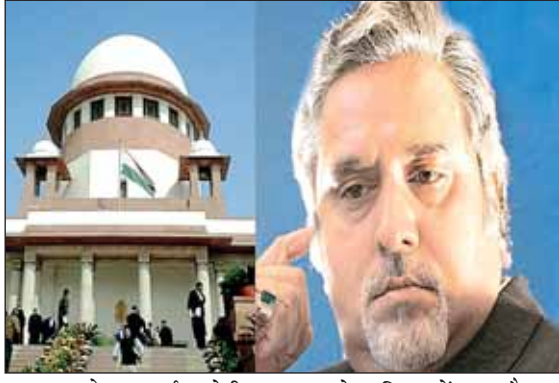
अगस्त को सुनवाई करेगी। माल्या ने याचिका में कहा है

कि सिर्फ किंगफिशर कंपनी से संबंधित संपत्ति ही जब्त की जाए। अपनी दलील में माल्या का कहना है कि उसकी निजी संपत्ति और परिवार के अन्य सदस्यों की संपत्ति जब्त नहीं की जाए, माल्या पर भारतीय बैंकों का नौ हजार करोड़ रुपये कर्ज लेने और बिना चुकाए फरार होने का आरोप है। शराब कारोबारी विजय माल्या को