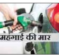
महंगाई की मार

नई दिल्ली (आरएनएस)। पेट्रोल और डीजल के दाम में वृद्धि का सिलसिला मंगलवार को लगातार छठे दिन जारी रहा। तेल विपणन कंपनियों ने पेट्रोल के दाम में दिल्ली में सात पैसे, कोलकाता में आठ पैसे जबकि मुंबई और चेन्नई में चार पैसे प्रति लीटर का इजाफा कर दिया है, जबकि डीजल के भाव दिल्ली में छह पैसे, कोलकाता में सात पैसे और मुंबई में चार पैसे प्रति लीटर बढ़ गए हैं। हालांकि चेन्नई में डीजल की कीमत स्थिर रही। देश की राजधानी दिल्ली में छह दिनों में पेट्रोल 46 पैसे प्रति लीटर महंगा हो गया है और डीजल का दाम भी 43 पैसे प्रति