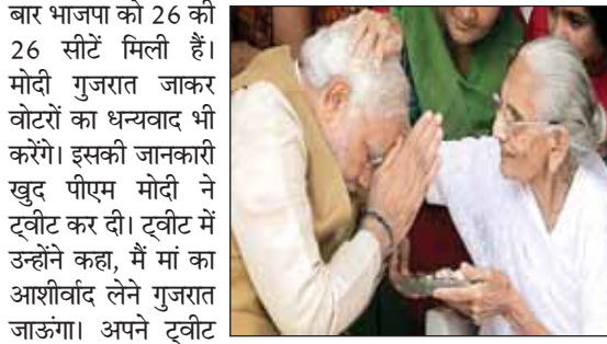
मां से मुलाकात की थी। अक्सर चुनाव में जीत दर्ज करने और जन्मदिन के अवसर पर नरेंद्र मोदी अपनी मां से आशीर्वाद लेने जाते हैं। 2014 में जब वह प्रधानमंत्री बने, तब भी उन्होंने सबसे पहले अपनी मां का आशीर्वाद लिया था। इससे पहले पीएम मोदी ने शुक्रवार को भाजपा के वरिष्ठ नेता लालकृष्ण आडवाणी तथा मुरली मनोहर जोशी के घर जाकर मुलाकात की थी तथा उनसे आशीर्वाद लिया था। सूत्रों से मिली जानकारी के अनुसार दूसरी बार प्रधानमंत्री पद के लिए श्री मोदी 30 मई गुरुवार शपथ ग्रहण कर सकते हैं। शपथ ग्रहण के अवसर पर मंत्रीमंडल के सहयोगियों के शपथ लेने की संभावना है। शपथ ग्रहण की तैयारियों के बीच विदेश के कई देशों के राष्ट्राध्यक्षों को भी कार्यक्रम में शामिल होने आमंत्रित किया जा रहा है।

नई दिल्ली (आरएनएस)। देश में प्रधानमंत्री नरेंद्र मोदी के नेतृत्व में भारतीय जनता पार्टी को मिले प्रचंड बहुमत हासिल करने के बाद श्री मोदी रविवार को अपनी मां का आशीर्वाद लेने गुजरात जाएंगे। गुजरात ने इस बार भाजपा को 26 की 26 सीटें मिली हैं। मोदी गुजरात जाकर वोटों का धन्यवाद भी करेंगे। इसकी जानकारी खुद पीएम मोदी ने ट्वीट कर दी। ट्वीट में उन्होंने कहा, मैं मां का आशीर्वाद लेने गुजरात जाऊंगा। अपने ट्वीट में पीएम मोदी ने कहा है कि उसके बाद मैं सोमवार को काशी जाऊंगा तथा वहां लोगों को शुक्रिया अदा करूंगा। बता दें पीएम मोदी इससे पहले 23 मई को मतदान के लिए गुजरात गए थे, तब उन्होंने