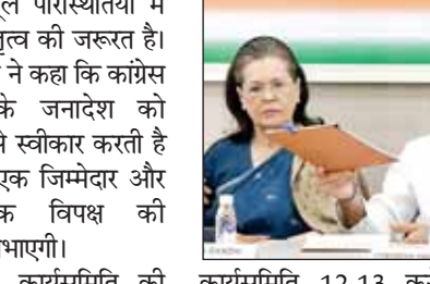
सुनिश्चित करेगी। राहुल के इस्तीफे की पेशकश को नामंजूर करते हुए प्रस्ताव में कहा गया है, कांग्रेस अध्यक्ष राहुल गांधी ने कांग्रेस कार्यसमिति के समुच्च अध्यक्ष पद से अपने इस्तीफे की पेशकश की, मगर कार्यसमिति के सदस्यों ने सर्वसम्मति व एक स्वर से इसे खारिज करते हुए कांग्रेस अध्यक्ष को आह्वान किया कि प्रतिकूल व चुनौतीपूर्ण परिस्थितियों में पार्टी को राहुल गांधी के नेतृत्व व मार्गदर्शन की आवश्यकता है।

नई दिल्ली। लोकसभा चुनाव में देश भर में करारी हार की जिम्मेदारी लेते हुए कांग्रेस अध्यक्ष राहुल गांधी ने इस्तीफे की पेशकश की है, लेकिन पार्टी की कार्यसमिति ने उनकी पेशकश को खारिज कर दिया है। बैठक खत्म होने के बाद कांग्रेस के मीडिया प्रभारी रणदीप सुरजेवाला ने अन्य नेताओं के साथ प्रेस कॉन्फ्रेंस में बताया कि राहुल की पेशकश को सर्वसम्मति से नामंजूर कर दिया गया। कार्यसमिति ने राहुल गांधी को यह कहते हुए पार्टी के संरचनात्मक ढांचे में आमूल-चूल परिवर्तन के लिए अधिकृत किया है कि पार्टी को प्रतिकूल परिस्थितियों में आपके नेतृत्व की जरूरत है। सुरजेवाला ने कहा कि कांग्रेस 2019 के जनादेश को विनम्रता से स्वीकार करती है और वह एक जिम्मेदार और सकारात्मक विपक्ष की भूमिका निभाएगी। कांग्रेस कार्यसमिति की बैठक के बाद मीडिया को संबोधित करते हुए कांग्रेस के मुख्य प्रवक्ता और मीडिया प्रभारी रणदीप सुरजेवाला ने कहा कि बैठक में एक प्रस्ताव पारित किया गया। पारित प्रस्ताव में कहा गया है, कार्यसमिति 2019 के जनादेश को विनम्रता से स्वीकार करती है। कांग्रेस कार्यसमिति 12.13 करोड़ साहसी व सजग मतदाताओं को धन्यवाद देती है, जिन्होंने कांग्रेस पार्टी में अपना विश्वास व्यक्त किया। कांग्रेस पार्टी एक जिम्मेदार व सकारात्मक विपक्ष के रूप में अपना कर्तव्य निभाएगी और देशवासियों की समस्याओं को सामने रख उनके प्रति सरकार की जवाबदेही के समुच्च अध्यक्ष पद से अपने इस्तीफे की पेशकश की, मगर कार्यसमिति के सदस्यों ने सर्वसम्मति व एक स्वर से इसे खारिज करते हुए कांग्रेस अध्यक्ष को आह्वान किया कि प्रतिकूल व चुनौतीपूर्ण परिस्थितियों में पार्टी को राहुल गांधी के नेतृत्व व मार्गदर्शन की आवश्यकता है।