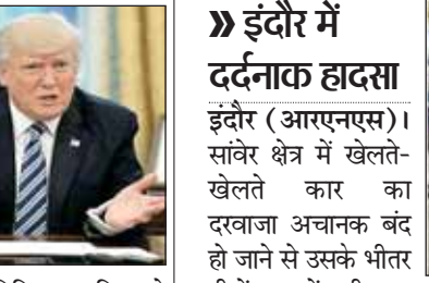
लौटते थे, मगर आज वे नहीं लौटते तो उनकी तलाश शुरू की गई। जब तीनों बच्चों का पता नहीं चला, तो गांव में ही बंद पड़ी कार को देखा गया तो तीनों बच्चे अचेत अवस्था में कार के भीतर मिले। उन्हें अस्पताल ले जाया गया, जहां चिकित्सकों ने उन्हें मृत घोषित कर दिया।

वाशिंगटन। अमेरिका में एक संघीय जज ने राष्ट्रपति डोनाल्ड ट्रम्प के राष्ट्रीय आपात की घोषणा के तहत दक्षिणी सीमा पर अरबों डॉलर खर्च कर दीवार बनाने की योजना पर अस्थायी रोक लगा दी है। अमेरिका के उत्तरी जिला कैलिफोर्निया के संघीय जज हेयवुड एस गिलियम जूनियर ने यह रोक लगायी है। श्री ट्रम्प ने अमेरिका और मैक्सिको की सीमा पर दीवार बनाने का आश्वासन बहुत पहले दिया था। इस दीवार से घुसपैठ और मादक पदार्थ तस्करी पर रोक लगायी जा सकेगी और यह श्री ट्रम्प के चुनावी अभियान का मुख्य मुद्दा था। राष्ट्रपति इस दीवार के निर्माण के लिए धन जुटाने के लिए कठिनाईयों का सामना कर रहे हैं क्योंकि कांग्रेस ने इसके लिए श्री ट्रम्प के अरबों डॉलर की धनराशि आवंटित करने के आग्रह को ठुकरा दिया है। श्री ट्रम्प ने कांग्रेस को दरकिनार कर आवश्यक धन जुटाने के लिए राष्ट्रीय आपदा की घोषणा की।