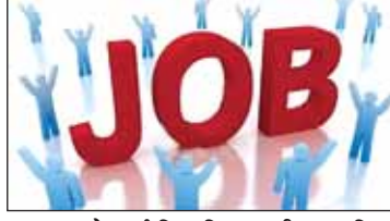
के पूर्व वित्त विभाग की अनुमति

राज्य के गंभीर वित्तीय संकट को देखते हुए आगामी एक वर्ष के लिए नई शासकीय नौकरियों की भर्तियों पर रोक लगा दी गई है। अनिवार्य होने पर भर्ती