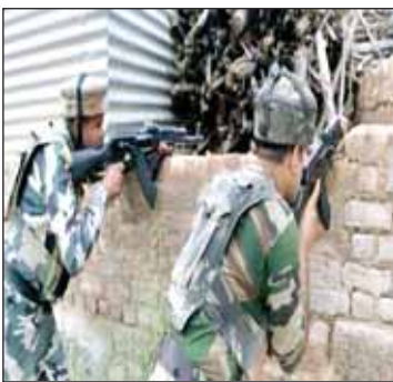
के जवानों ने संयुक्त रूप से शोपियां

श्रीनगर(आरएनएस)। दक्षिण कश्मीर के शोपियां जिले में शनिवार को घेराबंदी तथा तलाश अभियान के दौरान सुरक्षा बलों और आतंकवादियों के बीच मुठभेड़ में दो आतंकवादियों को मार गिराया। आधिकारिक सूत्रों ने बताया कि आतंकवादियों की मौजूदगी की गुप्त सूचना के आधार पर राष्ट्रीय राष्ट्रफल (आरआर), राज्य पुलिस के विशेष अभियान दल तथा केंद्रीय रिजर्व पुलिस बल (सीआरपीएफ) के गहंद गांव में आज घेराबंदी और तलाश अभियान शुरू किया। सुरक्षा बलों के जवान जब गांव में विशेष क्षेत्र की ओर बढ़ रहे थे तभी वहां छिपे आतंकवादियों ने स्वचालित हथियारों ने अंधाधुंध गोलीबारी शुरू कर दी। इसके बाद सुरक्षा बलों के जवानों ने भी जवाबी कार्रवाई की जिसमें दो आतंकवादी मारे गये। फिलहाल सुरक्षाबलों ने आतंकियों की तलाश के लिए सर्च ऑपरेशन चला रखा है। सूत्रों ने बताया कि अंतिम सूचना मिलने तक मुठभेड़ जारी थी। किसी तरह के प्रदर्शन को रोकने के लिए मुठभेड़ वाले स्थल के नजदीक स्थित गांवों में भारी संख्या में सुरक्षा बलों के जवानों को तैनात किया गया है। सूत्रों ने बताया कि किसी तरह के अफवाह को फैलाने से रोकने के लिए एहतियात इस क्षेत्र में मोबाइल इंटरनेट सेवा को स्थगित कर दिया गया है।