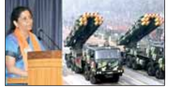
यह है कि भारत पारंपरिक तौर पर हथियारों का बड़ा आयातक है। अभी भी सेना को करीब 50 बरखा खरीद के लिए विदेशी सरकारों और कंपनियों पर निर्भर रहना पड़ता है। विवेकानंद इंटरनेशनल

नई दिल्ली। रक्षा मंत्री निर्मला सीतारमण ने कहा है कि भारत के पास डिफेंस क्षेत्र में निर्यातक बनने की क्षमता है। उन्होंने दावा किया कि कई देश भारत से संबंध स्थापित कर रक्षा उत्पादों को खरीदने में दिलचस्पी दिखा रहे हैं। रक्षा मंत्री के मुताबिक, भारत की मिसाइलों को कई देश अपने हथियारों के जखीरे में शामिल करना चाहते हैं। सीतारमण का यह बयान काफी महत्वपूर्ण माना जा रहा है। इसकी वजह फाउंडेशन के एक इवेंट में रक्षा मंत्री ने कहा, हमारे इंटिग्रेटेड मिसाइल प्रोग्राम की दुनियाभर में बात होती है, क्योंकि इसके नतीजे हर किसी को पता हैं। मैं यह बताना चाहती हूँ कि उत्पादकों के पास भारतीय सेना के अलावा भी एक बाजार मौजूद है। उन्होंने बताया कि दुनिया को भारत की वॉरशिप और साधारण शिप बनाने की क्षमता का भी अंदाजा है। इसी लिए कई देश हमसे रक्षा उत्पाद बनाने में मदद मांग रहे हैं।