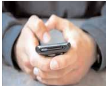
31 जुलाई 2018 से लेकर 31 मार्च 2019 के बीच मोबाईल फोन क्रमांक

रायपुर (आरएनएस)। रिटायर्ड हेड मास्टर ने एक महिला 30 वर्ष के मोबाईल फोन पर एक साल से लगातार अश्लील मैसेज करके परेशान कर रहा था। घटना की जानकारी महिला ने अपने पति को देकर मैसेज करने वाले को मिलने बुलाया तब पता चला कि अश्लील मैसेज भेजने वाला व्यक्ति रिटायर्ड हेड मास्टर है। प्राथिना ने घटना की रिपोर्ट गुड़ियारी थाने में दर्ज करायी है। मिली जानकारी के अनुसार रामनगर गुड़ियारी निवासी महिला ने रिपोर्ट दर्ज करायी है कि