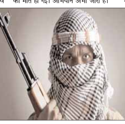
एक पुलिस सूत्र ने कहा, मुठभेड़ में पांच सैनिक घायल हो गए। उन्हें अस्पताल में भर्ती कराया गया है। मुठभेड़ स्थल के निकट सुरक्षाकर्मीयों और स्थानीय प्रदर्शनकारियों के बीच झड़प के दौरान चार प्रदर्शनकारी घायल हो गए। सूत्रों ने कहा कि घायल प्रदर्शनकारियों को अस्पताल में भर्ती कराया गया है। कहा जा रहा है कि गोली लगने से एक प्रदर्शनकारी की मौत हो गई है।

श्रीनगर (आरएनएस)। जम्मू एवं कश्मीर के सीमावर्ती जिले कुपवाड़ा में शुरुवार को सुरक्षा बलों के साथ मुठभेड़ में 5 सुरक्षाकर्मी शहीद हो गए और पांच अन्य घायल हो गए। एक स्थानीय नागरिक की मौत की खबर है। रक्षा विभाग के सूत्रों ने यह जानकारी दी। सूत्रों ने बताया कि मुठभेड़ में लैंगेट क्षेत्र के कालगुंद गांव में दो आतंकवादी मारे गए, जिनके शव बरामद कर लिए गए हैं। पुलिस ने कहा, मुठभेड़ बंद होने के बाद खोजी अभियान के दौरान मृत माने गए दो आतंकवादियों में से एक उठ गया और सुरक्षाकर्मीयों पर अंधाधुंध गोलीबारी करने लगा, जिसमें तीन सुरक्षाकर्मीयों और दो स्थानीय पुलिसकर्मीयों की मौत हो गई। अभियान अभी जारी है।