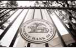
रिजर्व बैंक (आरबीआई) की एक अहम बैठक है जिसमें

नई दिल्ली। देश के शेयर बाजार के लिए बीता हफ्ता काफी बेहतर था लेकिन कल से शुरू होने वाला दिसम्बर का पहला कारोबारी हफ्ता बाजार के लिए कैसा होगा इसका निर्णय कल होगा। दरअसल कल भारतीय