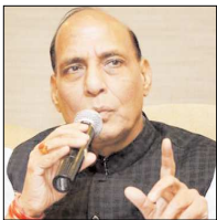
समझौते होगी कि बंदूकों से घर नहीं बसते, बल्कि बर्बाद होते हैं। इसलिए

रायपुर (आरएनएस)। बंदूकों से न तो खुद का भला हो सकता है न समाज का और न ही देश का। इसलिए नक्सली हिंसा का रास्ता छोड़ समाज की मुखधार से जुड़ो।