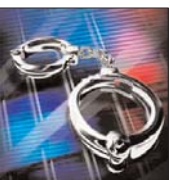
आरोपी अपने पहचान छिपाने के लिए मंकी कैप पहनकर रात में घुम-घुम कर चोरी की वारदात को अंजाम देते थे। सभी आरोपी मूलतः ओडिशा के रहने वाले हैं।

रायपुर (आरएनएस)। राजधानी रायपुर के आधा दर्जन से अधिक मकानों में चोरी की वारदात में शामिल 6 आरोपियों को पुलिस गिरफ्तार करने में सफलता हासिल की है। आरोपियों के पास से चोरी के माल सूत, चैन, चूड़ी, अंगुठी, लॉकेट, सोने की भाँजा, कान के मालू, कान का ठोपन, कान, झुमका, रानी हार, ईयर रिंग, नक्केल, वाली, ब्रेसलेट, अन्य सोने के जेवरतरी कीमती लगाम 17 लाख रुपये एवं नगद 14 हजार रुपये बरामद किया है। आरोपी अपनी पहचान छिपाने के लिए मंकी कैप पहनकर रात में घुम-घुम कर चोरी की वारदात को अंजाम देते थे। सभी आरोपी मूलतः ओडिशा के रहने वाले हैं।