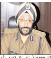
और उनकी टीम को नेस्तनाबूद की स्थिति तक ला देने में उनका बहुत बड़ा योगदान है। छोटी-छोटी समस्यओं जैसे जमीन खरीदी-बिक्री