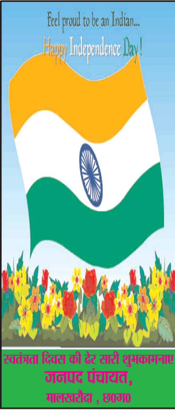
स्वतंत्रता दिवस की ढेर सारी शुभकामनाएं जनपद पंचायत, मालखरीटा, छगगो