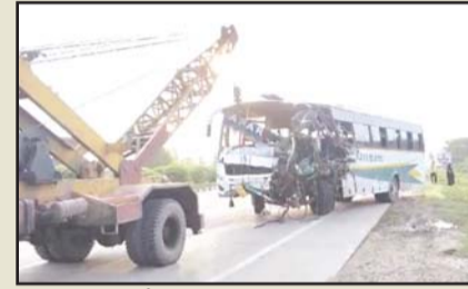
रवाना हुए थे।

जानकारी के अनुसार, बस चालक को झपकी लग गई, जिसके कारण यह दुर्घटना हुई। मृतकों में बस का खलासी, एक पंडा (पुजारी) और एक यात्री शामिल हैं। सभी मृतक यूपी के बाराबंकी जिले के रहने वाले थे, जो गया में पिंडदान कर लौट रहे थे। पिंडदान के बाद बस में सवार सभी लोग जगन्नाथ पुरी दर्शन कर विन्ध्यचल मंदिर की ओर