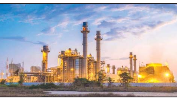
उम्मीद है, यदि ऐसा हुआ तो लैंको छत्तीसगढ़ का दूसरा सबसे बड़ा पावर प्लांट बनेगा। इससे देश और प्रदेश को अतिरिक्त बिजली मिलेगी। साथ ही साथ रोजगार के भी नए अवसर पैदा होंगे। बैंक लोन के एनपीए होने से पहले सितंबर 2019 में एनसीएलटी में वाद

कोरबा | आरएनएस लैंको पावर प्लांट को जल्द ही अडानी ग्रुप टेकओवर करेगा। एनसीएलटी के आदेश के बाद से 4100 करोड़ रुपये में डील फाइनल हुई है। हालांकि इस पूरी प्रक्रिया में 2 महीने का समय लगेगा। लैंको अमरकंटक की क्षमता फिलहाल 600 मेगावाट है। लंबे समय से लैंको अमरकंटक पावर प्लांट वित्तीय संकट से जूझ रहा है। इसके कारण ही 660M2 मेगावाट की दो इकाइयां निर्माणाधीन अवस्था में हैं, जिनका 60 से 70 फीसदी काम पूरा हो चुका है। अडानी समूह द्वारा अधिग्रहण किए जाने के बाद अर्धे इकाइयों के भी जल्द पूरा होने की