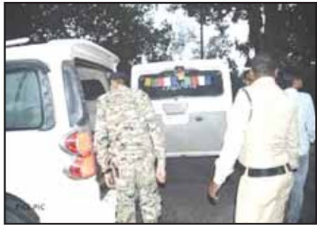
आयुक्त ने सभी अधिकारियों को उनके क्षेत्र में पड़ने वाले गोदामों की जांच के लिए निर्देशित किया गया है। अब-तक 377 गोदामों की जांच करके स्टॉक में अंतर पाये जाने पर व्यापारियों को 21.05 लाख रुपये जमा कराये गये हैं। विभाग के अधिकारियों द्वारा पुलिस प्रशासन का सहयोग निष्पक्ष

अधिकारियों से समन्वय करने और संयुक्त जांच करने की हिदायत भी दी गई है। राज्य के भीतर भी 15 टीमों के द्वारा ई-वे बिल की जांच लगातार की जा रही है। राज्य कर विभाग द्वारा 01 जुलाई 2023 से 31 अक्टूबर 2023 तक कुल 10.10 करोड़ का माल जोब किया जा चुका है। विभाग की नजर रेल्वे और बसों से भेजे जाने वाले सामानों पर भी है। रेल्वे से परिवहन माल पर भी गलती पाये जाने पर इस दौरान 40.81 लाख की पेनाल्टी लगाई जा चुकी है। चुनाव में मुफ्त बांटे जाने वाले सामान की धरपकड़ सुनिश्चित करने के