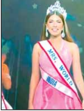
इंतजार खत्म हो गया है। 21 साल बाद तारा हमारे पास वापस आ गया है। समारोह के बाद एक वीडियो में