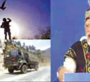
एक के बाद एक उसके निर्माण का काम तेज गति से चल रहा है। जो सीमावर्ती गांव कभी वीरान हुआ करते थे, हम उन्हें वाइब्रेंट बनाने में जुटे हैं। जो गति हमारे शहरों के लिए महत्वपूर्ण है, हमारे बॉर्डर पर भी वही गति होनी आवश्यक है। इससे यहां टूरिज्म भी बढ़ेगा और जो लोग गांव छोड़कर गए हैं, वे वापस लौट के आएंगे। पीएम मोदी ने कहा कि मेघालय के विकास के लिए 7 लाख करोड़

उन्होंने कहा कि खेलों को लेकर केंद्र सरकार आज एक नई अग्रोच के साथ आगे बढ़ रही है। इसका फायदा नॉर्थ ईस्ट के युवाओं को हुआ है। देश की पहली स्पोर्ट्स यूनिवर्सिटी नॉर्थ ईस्ट में है। उन्होंने कहा, 'लंबे समय तक देश में यह सोच रही है कि बॉर्डर एरिया में विकास हुआ, कनेक्टिविटी बेहतर नहीं हो पाई। लेकिन आज डंके की चोट पर बॉर्डर पर नई सड़कें, नई टनल, नए पुल, नई रेल लाइन, नए एयर स्ट्रिप, जो भी आश्चर्य है, के कारण नॉर्थ-ईस्ट समेत देश के सभी सीमावर्ती क्षेत्रों में कनेक्टिविटी बेहतर नहीं हो पाई। लेकिन आज डंके की चोट पर बॉर्डर पर नई सड़कें, नई टनल, नए पुल, नई रेल लाइन, नए एयर स्ट्रिप, जो भी आश्चर्य है,