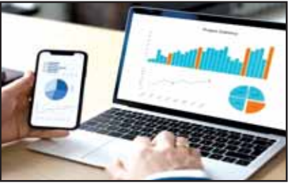
नगरिकों के तीव्र डिजिटलीकरण और आंकड़ों की बढ़ती हुई संख्या पर प्रकाश डाला, जिसके लिए इस डेटा की क्षमता का दोहन करने के लिए एक रूपरेखा तैयार करने की आवश्यकता

नई दिल्ली। सरकार ने राष्ट्रीय डेटा गवर्नेंस फ्रेमवर्क नीति के मसौदे पर हितधारकों की राय जानने के लिए परिचर्चा की है। इलेक्ट्रॉनिक्स एवं सूचना प्रौद्योगिकी और कौशल विकास एवं उद्यमिता राज्य मंत्री राजीव चंद्रशेखर की उपस्थिति में इस पर हितधारकों के साथ परिचर्चा की गयी है जिसमें उद्योग, स्टार्ट-अप, अकादमिक, थिंक टैंक, अंतर्राष्ट्रीय सहयोगी और विभिन्न मंत्रालयों के सरकारी अधिकारियों सहित 250 से ज्यादा हितधारक शामिल हुए। श्री चंद्रशेखर ने भारत में सरकारों और