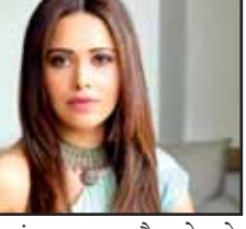
प्यार का पंचनामा 2 और सोनू के टूट की स्वीटी के समय, मेरी चाची कहती थीं, अगली बार तू कुछ ऐसी फिल्म क्यों नहीं करती जहां पर तू वास्तव में कुछ कर रही हो, फिर जब छलंग, छोरी जैसी फिल्में या अजीब दास्तान जैसी वेब प्रोजेक्ट आईं तो मैं एक अभिनेत्री के रूप में संतुष्ट महसूस

बॉलीवुड अभिनेत्री नुसरत भरुचा अपनी हाल ही में रिलीज हुई फिल्म जनहित में जारी में किए गए काम को लेकर बेहद संतुष्ट हैं। दिवाकर बनर्जी की अत्यधिक प्रयोगात्मक एंथोलॉजी ड्रामा लव सेक्स और धोखा और प्यार का पंचनामा जैसी फिल्मों में बोलड और ग्लैमरस भूमिकाओं के साथ अपने करियर की शुरुआत करने वाली नुसरत ने गियर बदलते हुए और फिल्मों में अधिक परिभाषित भूमिकाएं निभाई हैं। इसके बारे में बात करते हुए, नुसरत ने कहा कि प्यार का पंचनामा,