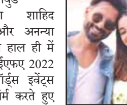
कपूर और अनन्या पांडे को बतौर लीड जोड़ी के रूप में देखने की प्रतीक्षा कर रहे हैं। खैर आपको अब और उम्मीद करने की जरूरत नहीं है क्योंकि शाहिद के पास अब आपके लिए जिसका जवाब है कि क्या हम उन्हें और अनन्या को जल्द ही एक मूवी में साथ देख सकते हैं। शाहिद कपूर और अनन्या पांडे को आईआईएफए 2022 में शानदार प्रदर्शन करते हुए देखा जा चुका है।