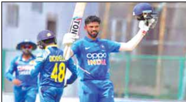
ऋतुराज मौजूदा टीम से बाहर होने वाले तीसरे खिलाड़ी हैं। दोनों को कोलकाता के ईडन गार्डंस में वेस्टइंडीज के खिलाफ आखिरी टी20 मैच के दौरान चोट लग गई थी।

नई दिल्ली। भारतीय क्रिकेट टीम के सलामी बल्लेबाज ऋतुराज गायकवाड़ श्रीलंका के साथ जारी तीन मैचों की टी20 सीरीज से बाहर होने के बाद अब नेशनल क्रिकेट अकेडमी (एनसीए) जाएंगे, जहां वह अपनी चोट से उबरने पर काम करेंगे। बीसीसीआई ने एक बयान जारी कर इसकी जानकारी दी है। गायकवाड़ ने दाहिनी कलाई में दर्द की शिकायत थी, जिससे उनकी बल्लेबाजी प्रभावित हो रही थी। इस वजह से वह पहले टी20 के लिए चयन के लिए अनुपलब्ध थे। बीसीसीआई की मेडिकल टीम ने उनकी जांच करने के बाद पाया कि