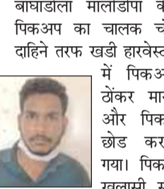
ओर जा रही थी जिसे हाथ देकर स्टाफ रोकने का प्रयास किये तो पिकअप का चालक, वाहन को ओर तेज कर भागने लगा। पुलिस की वाहन पिकअप का पीछ करने लगी तो कुछ दूर आगे जाकर