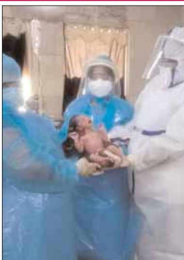
टैक कर, उनका उपचार किया जा रहा है। इसी बीच कोरोना पाजीटिव गर्भवती महिलाओं का सुरक्षित प्रसव कराना अपने आप में एक बड़ी चुनौती होती है। ऐसा ही एक मामला सामने आया है

रायगढ़ । कोरोना महामारी के इस कठिन दौर में सामुदायिक स्वास्थ्य केन्द्र बरमकेला के डॉक्टर्स एवं नर्सिंग स्टाफने एक कोरोना पीड़ित महिला की सफल डिलीवरी करायी। जच्चा-बच्चा दोनों स्वस्थ हैं। बच्चे की कोविड रिपोर्ट नैगेटिव है।