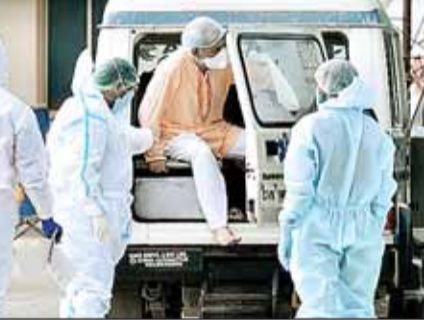
सैंपल की जांच के साथ ही टेस्ट प्रति मिलियन (टीपीएम) और भी अधिक बढ़कर 11,485 के स्तर पर पहुंच गया है तथा कुल टेस्ट की संख्या बढ़कर 1,58,49,068 के आंकड़े को छू गई है। इन दोनों में ही निरंतर वृद्धि दर्ज की जा रही है। यह उत्साहवर्धक उपलब्धि प्रयोगशालाओं की संख्या लगातार बढ़ने से ही संभव हो पाई है जिसकी संख्या जनवरी 2020 में केवल 01 से बढ़कर आज बढ़कर 1301 हो गई है, जिनमें 902 सरकारी लैब (प्रयोगशाला) और निजी क्षेत्र की 399 लैब शामिल हैं। आईसीएमआर के टेस्टिंग

नईदिल्ली, 25 जुलाई (आरएनएस)। पहली बार एक ही दिन में रिकॉर्ड संख्या में 4,20,000 से भी अधिक कोविड टेस्ट किए गए हैं। इससे ठीक पिछले दिन 3,50,000 कोविड टेस्ट किए जाने के बाद यह नया रिकॉर्ड बना है। यह उत्साहवर्धक क्रम पिछले एक सप्ताह से निरंतर जारी है। पिछले 24 घंटों में 4,20,898