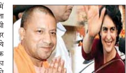
भयावह हो सकते हैं। उन्होंने कहा कि प्रदेश में चारटीन सेंटर और अस्पतालों की स्थिति बेहद दयनीय है। कई जगह लोग कोरोना से नहीं बल्कि सरकार की व्यवस्था से डर रहे हैं और टेस्ट के लिये सामने नहीं आ रहे हैं। कोरोना का डर दिखाकर पूरे तंत्र में भ्रष्टाचार भी पनप रहा है। इस पर समय रहते लगाम न कसी गयी जो तो कोरोना की लड़ाई आपदा में बदल जायेगी।

लखनऊ (आरएनएस)। उत्तर प्रदेश में कोरोना संक्रमण के बढ़ते मामलों के प्रति चिंता जताते हुये कांग्रेस महासचिव प्रियंका गांधी वाड़ा ने उत्तर प्रदेश के मुख्यमंत्री योगी सरकार को पत्र लिखकर हालात से निपटने के लिये कुछ सुझाव दिये हैं और साथ ही वैश्विक महामारी के खिलाफ सरकार की मदद करने का भरोसा दिलाया है। श्रीमती वाड़ा के शुक्रवार को लिखे पत्र को पार्टी ने आज साझा किया। उन्होंने लिखा कि कोरोना संक्रमण के बढ़ते प्रभाव से अब गांव देहात भी अछूते नहीं हैं। इससे पता चलता है कि सरकार ने नो टेस्ट नो कोरोना की नीति अपना रखी थी और अब कोरोना के मामले विस्फोट की स्थिति में हैं। जब तक पारदर्शी तरीके से टेस्ट नहीं बढ़ाये जायेंगे, तब तक लड़ाई अधूरी रहेगी और हालात और