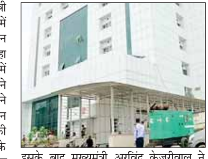
इसके बाद मुख्यमंत्री अरविंद केजरीवाल ने कहा था कि सरकार प्लाजा मुफ्त दे रही है और लोगों को उसे खरीदने या बेचने की जरूरत नहीं है। गुरुवार को यहां संक्रमितों की कुल संख्या 1,27,364 हो गई थी।

नईदिल्ली (आरएनएस)। दिल्ली के मुख्यमंत्री अरविंद केजरीवाल ने शनिवार को बुराड़ी में बने 450 बेड के नए अस्पताल का उद्घाटन किया। इस मौके पर सीएम केजरीवाल ने कहा कि आज कोरोना अस्पताल में कुल बेड में 450 बेड और जुड़ जायेंगे। साथ ही उन्होंने कहा कि यह कहना सही नहीं होगा कि हमने कोरोना के खिलाफ लड़ाई जीत ली है। लेकिन पिछले एक महीने में कोरोना के मामले काफी कम हुए हैं। साथ ही मौतें भी कम हुई हैं। इसके लिए सबको बधाई। उन्होंने कहा कि 450 बेड जो आज शामिल हुए हैं, इससे दिल्ली के लोगों को कोरोना के खिलाफ लड़ाई में मदद मिलेगी। बता दें कि गुरुवार को दिल्ली में 1,041 लोग कोरोना वायरस से संक्रमित पाए गए थे।