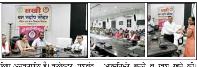
हालांकि कुछ मामले जैसे कुपोषण, श्रेयलू हिंसा, लैंगिक उत्पीड़न अभी भी समाज में व्याप्त है, जिनसे निपटने के लिए शासन-प्रशासन स्तर पर हर संभव प्रयास किया जा रहा है। आवश्यकता है तो महिलाओं को अपने अधिकारों तथा जरूरतों के प्रति जागरूक होकर अपनी आवाज बुलंद करने की तथा

उन्होंने कार्यक्रम में महिलाओं को संबोधित करते हुए महिला दिवस की बधाई दी और कहा कि आज महिलाएं पुरुषों के साथ कंधे से कंधा मिलाकर चल रही हैं। रायगढ़ जिले की बात करें तो यहां की महिलाएं खेल, कला, शिक्षा, साहित्य सभी क्षेत्रों में अपना अलग मुकाम हासिल कर रही हैं तथा उनकी उपलब्धियां समाज में सभी के