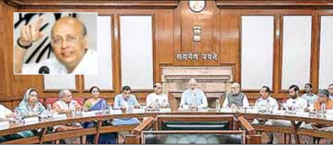
पड़ेगा। उन्होंने कहा कि एलआईसी जीवन बीमा का 70 फीसदी बाजार नियंत्रित करती है। इसमें भी विनिवेश करने का प्रस्ताव है। सरकार एक तरफ इसका निजीकरण करती है और दूसरी तरफ प्रीमियम में वृद्धि कर रहे हैं। यह

इसी तरह जीवन बीमा से कहां कि बीमा के संदर्भ में दो अत्यंत दुर्भाग्यपूर्ण निर्णय होने जा रहे हैं। दोपहिया वाहन और चार पहिया वाहनों पर थर्ड पार्टी बीमा की प्रीमियम राशि में बढ़ोतरी का प्रस्ताव है।