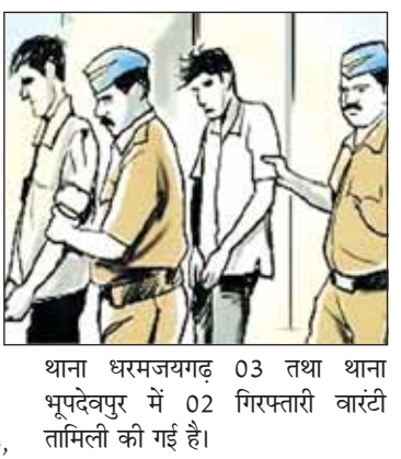
थाना धरमजयगढ़ 03 तथा थाना भूपदेवपुर में 02 गिरफ्तारी वारंटों तामिली की गई है।