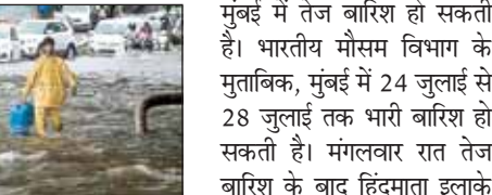
मुंबई में तेज बारिश हो सकती है। भारतीय मौसम विभाग के मुताबिक, मुंबई में 24 जुलाई से 28 जुलाई तक भारी बारिश हो सकती है।

मॉनसूनी मौसम में भारी बारिश होने के कारण मुंबई के कई इलाकों में भारी जलजमाव की स्थिति बनी हुई है। भारी बारिश के कारण मुंबई की लाइफलाइन कहे जाने वाले रेल यातायात पर भी बुरा असर पड़ा है। कई मेन रेल ट्रैक्स पर पानी भर गया है। बीएमसी ने भी टवीट कर कहा है कि मौसम विभाग ने अगले 24 घंटों के भीतर आर्थिक राजधानी में