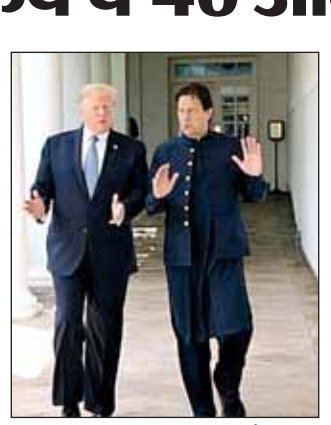
उन्होंने कहा कि यह बहुत महत्वपूर्ण था कि वह राष्ट्रपति डोनाल्ड ट्रंप और अन्य शीर्ष अमेरिकी नेताओं से मिलें। उन्होंने कहा, हमने उन्हें बताया कि आगे बढ़ने के लिए हमारे रिश्ते आपसी विश्वास पर आधारित होने चाहिए। खान ने कहा कि उन्होंने अमेरिका को ईमानदारी से बताया कि पाकिस्तान शांति प्रक्रिया में क्या कर सकता है।

वह कांग्रेसनल पाकिस्तान कॉकस की अध्यक्ष शीला जैक्सन ली द्वारा आयोजित एक कार्यक्रम को संबोधित कर रहे थे। ली भारत और भारतीय अमेरिकियों पर कांग्रेस के कॉकस की भी सदस्य हैं। पाकिस्तान के प्रधानमंत्री ने कहा, पाकिस्तान में 40 अलग-अलग