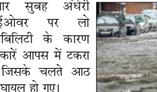
बुधवार सुबह अंधेरी फ्लाईओवर पर लो विजिबिलिटी के कारण तीन कारों आपस में टकरा गईं, जिसके चलते आठ लोग घायल हो गए।

बुधवार सुबह अंधेरी में लो विजिबिलिटी के कारण तीन कारों आपस में टकरा गईं। इस हादसे में आठ लोग घायल हो गए। जानकारी के अनुसार,