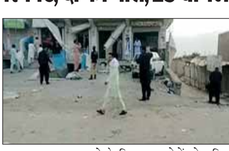
तनाव उत्पन्न करने के लिए आम लोगों को लक्षित करके इस वारदात को अंजाम दिया। उन्होंने बताया कि इस इलाके में आतंकवादी इस तरह की वारदातों को अंजाम देते रहते हैं।

अभी तक किसी भी समूह या व्यक्ति ने इस इमले को जिम्मेदारी नहीं ली है, लेकिन पूर्व में इस तरह की वारदातों को अंजाम बलूच नेशनलिस्ट समूह के आतंकवादी देते रहे हैं।