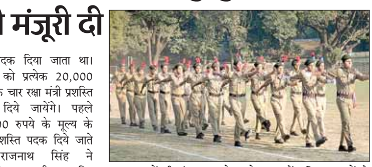
इन पुरस्कारों की संख्या 27 हो गई है। प्रत्येक पुरस्कार के लिए नकद प्रोत्साहन में भी वृद्धि की गई है। ये पुरस्कार नई दिल्ली में गणतंत्र दिवस समारोह के दौरान प्रदान किए जाते हैं।

रक्षा मंत्री ने विभिन्न श्रेणियों में एनसीसी कैडेटों के लिए 9 नए सर्वश्रेष्ठ कैडेट पुरस्कारों को भी मंजूरी दी है। इस तरह