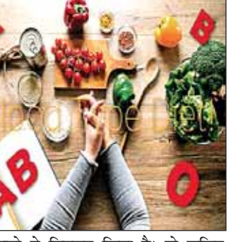
डीअडामो ने डिवलप किया है। तो चलिए जानते हैं कि आपके ब्लड ग्रुप के हिसाब से कौन सी है बेस्ट डाइट और एक्ससाईज।

फिट रहने के लिए कैसी डाइट लेनी चाहिए और कैसी नहीं इसे लेकर लोग कई तरह की रिसर्च करते हैं। सिलेब्रिटीज जैसी बॉडी पाने के लिए वह वर्कआउट से लेकर खाने की चीजों पर काफी पैसे भी खर्च करते हैं। लेकिन क्या आप जानते हैं कि आपकी बॉडी को कौन सा फूड और कौन सी एक्ससाईज सूट करेगी उसका आपके ब्लड ग्रुप से गहरा नाता है।