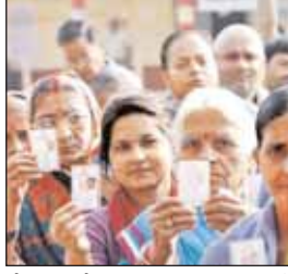
तो वह लोकसभा का चुनाव नहीं लड़ सकता।

रायपुर (आरएनएस)। देश की सबसे बड़ी लोकतांत्रिक संस्था लोकसभा का चुनाव लड़ने हेतु किसी भी भारतीय नागरिक की न्यूनतम आयु 25 वर्ष होनी चाहिए। आयु की यह गणना नामांकन की तिथि तक होती है। व्यक्ति का नाम वर्तमान मतदाता सूची में मतदाता के रूप में पंजीकृत होना चाहिए। सजायाफ्ता व्यक्ति चुनाव नहीं लड़ सकता। इस प्रकार यदि कोई व्यक्ति मतदाता है तथा उसकी उम्र 25 वर्ष है तो देश के किसी भी निर्वाचन क्षेत्र के साथ लोकसभा का चुनाव लड़ सकता है। यदि व्यक्ति 25 वर्ष से कम उम्र का है