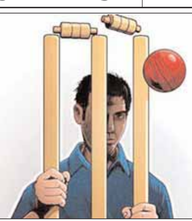
रहे लोगों द्वारा प्रदेश के सभी जिलों के सटोरियों के नंबर मौजूद है।

रायपुर (आरएनएस)। राजधानी रायपुर के रामसागरपारा स्थित एक मकान में पुलिस ने छापामारकर आईपीएल क्रिकेट मैच में चेन्नई व दिल्ली टीम के मैच के दौरान सट्टा पट्टी लिख रहे 5 लोगों को गिरफ्तार किया है। उनके पास से बड़ी संख्या में लेपटॉप व मोबाईल फोन सहित वाईस रिकार्डर एवं हाईटेक कम्प्यूटर सेट बरामद होने पर कड़ाई से पूछताछ करने पर जानकारी मिली है कि सटोरियों के संबंध दिल्ली, मुंबई व दुबई से जुड़ा हुआ है। राजधानी में आईपीएल मैच के दौरान सट्टा खेला