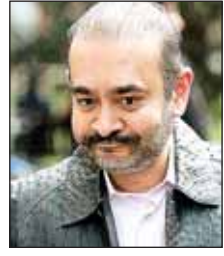
गिरफ्तारी हुई है। उन्होंने कहा, भारत सरकार नीरव मोदी के शीघ्र प्रत्यर्पण को लेकर प्रतिबद्ध है। कृष्णमूरति ने कहा कि ब्रिटेन की 'क्राउन प्रॉसेक्यूशन सर्विस' ने भारत को 18 मार्च को बताया था कि 'वेस्ट मिंस्टर मजिस्ट्रेट अदालत के वरिष्ठ न्यायाधीश ने

नीरव मोदी के खिलाफ वारंट जारी किया है। प्रवर्तन निदेशालय ने धन शोधन के एक मामले में नीरव मोदी के प्रत्यर्पण के लिये अनुरोध किया था जिसपर कार्रवाई करते हुए व्यापारी के खिलाफ गिरफ्तारी का वारंट जारी किया गया था। ब्रिटेन की एक अदालत ने बुधवार को नीरव मोदी को 29 मार्च तक हिरासत में भेजने का आदेश दिया था।