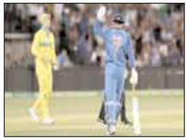
सरजमी पर ऑस्ट्रेलिया के

नई दिल्ली। ऑस्ट्रेलिया टीम भारत आई है। टीम इंडिया ने ऑस्ट्रेलियाई सरजमी पर शानदार प्रदर्शन किया था। तो एक बार फिर से इस बार ऑस्ट्रेलिया टीम इस महीने भारत के दौरे पर आएगी। टीम इंडिया को अपनी