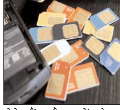
होते हैं और इन्हें केवल आपके फोन पर आने वाले ओटीपी की जरूरत होती है। सिम स्वैप करते ही इन्हें ओटीपी भी मिल जाता है। हालांकि थोड़ी सी होशियारी बरतें तो आप ऐसी धोखाधड़ी से बच सकते हैं।

नई दिल्ली (आरएनएस)। साइबर अपराधी लोगों को ठगने के लिए अब सिम स्वैप को हथियार के रूप में इस्तेमाल कर रहे हैं। इसके तहत ये ठग आपके मोबाइल सिम का डुप्लीकेट सिम हासिल करके सीधे बैंक खाते में सेंधमारी करते हैं और आपको इसकी भनक तक नहीं लगने पाती। डुप्लीकेट सिम ठगों के हाथ लगते ही आपका सिम काम करना बंद कर देता है। इनके पास आपके बैंक डिटेल्स पहले से