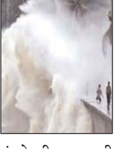
मौसम विभाग ने कहा कि अंडमान द्वीप में समुद्र की स्थिति काफी भयानक हो सकती है। 5 जनवरी की शाम से 7 जनवरी की सुबह तक यह स्थिति बनी रह सकती है। इसके अलावा निकोबार द्वीप पर 6 जनवरी को समुद्र काफी उफान पर होगा।

नई दिल्ली (आरएनएस)। थाईलैंड के चक्रवाती तूफान पाबुक ने अपना मुख भारत की तरफ कर लिया है। भारत के मौसम विभाग ने अलर्ट जारी करते हुए कहा अंडमान द्वीप जनवरी की सुबह तक यह स्थिति बनी रह सकती है। इसके अलावा निकोबार द्वीप पर 6 जनवरी को समुद्र काफी उफान पर होगा।