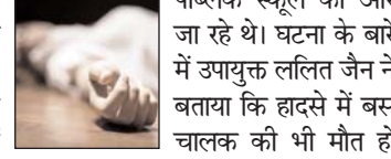
पब्लिक स्कूल की ओर जा रहे थे। घटना के बारे में उपायुक्त ललित जैन ने बताया कि हादसे में बस चालक की भी मौत हो गई, जबकि 11 छात्र घायल हो गए हैं। सभी घायलों को इलाज के लिए अस्पताल में भर्ती करा दिया गया है। प्रत्यक्षदर्शियों ने बताया कि प्रशासन ने बस से पीड़ितों को काफी मशकत के बाद बाहर निकाला।

मॉस्को (आरएनएस)। मध्य थाईलैंड के ख्लोंग लुआंग जिले में एक बस के दुर्घटनाग्रस्त हो जाने से छह लोगों की मौत हो गयी जबकि 50 अन्य घायल हो गये। बैंकाक पोस्ट ने रविवार को अपनी रिपोर्ट में बताया कि फनोम फ्राय से बैंकाक की ओर जा रही डबल-डेकर बस अनियंत्रित होकर सड़क पर पलट गयी।