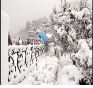
को अनुमति नहीं दी गई। कश्मीर घाटी में श्रीनगर और अन्य जगहों पर रातभर बर्फबारी के बाद शनिवार सुबह और बर्फबारी हुई। श्रीनगर-जम्मू राजमार्ग और मुगल रोड जो कश्मीर घाटी को जम्मू क्षेत्र से जोड़ता है, बर्फबारी के चलते बंद रहे।

मौसम विभाग ने कहा कि जम्मू और कश्मीर में पिछले 24 घंटों के दौरान मैदानी इलाकों में कम और ऊंचे पहाड़ी इलाकों में भारी बर्फबारी हुई है। मौसम विभाग के एक अधिकारी ने कहा कि अगले 24 घंटों में रविवार सुबह तक और ज्यादा बर्फबारी होने के आसार हैं, जिसके बाद मौसम में सुधार होगा। कम दृश्यता के कारण और रनवे से बर्फ हटाने में आ रही दिक्कतों के चलते श्रीनगर अंतरराष्ट्रीय हवाईअड्डे पर शनिवार सुबह से न कोई विमान उतरा और न किसी विमान ने उड़ान भरी।