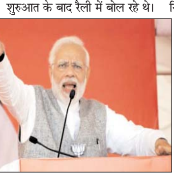
यूपीए के दौरान सेना को कमजोर करने की रची गई साजिश

बारीपदा, ओडिशा (आरएनएस)। शुरुआत के बाद रैली में बोल रहे थे। प्रधानमंत्री नरेंद्र मोदी ने शनिवार को ओडिशा में बारीपदा की रैली में कांग्रेस के साथ-साथ राज्य की नवीन पटनायक सरकार पर तीखे हमले बोले। पीएम ने कहा कि यूपीए सरकार के दौरान पीएमओ की फाइलों तक बिचौलियों की पहुंच थी। वीवीआईपी हेलिकॉप्टर घोटाले के बिचौलिये क्रिस्चन मिशेल के बहाने कांग्रेस पर हमला करते हुए उन्होंने कहा कि समझ नहीं आता कि कांग्रेस ने सरकार चलाई है या अपने मिशेल मामा का दरबार चलाया है। पीएम ने कहा कि हमारी सरकार देश की सेनाओं को साजिश के जाल से बाहर निकाल रही है, इसीलिए वह उनको (कांग्रेस) कांटे की तरह चुभ रहा है। उन्होंने कहा कि चौकीदार को रास्ते से हटाना चाहती है। वह मयूरभंज जिले के बारीपदा में करोड़ों के इन्फ्रास्ट्रक्चर प्रॉजेक्ट्स की